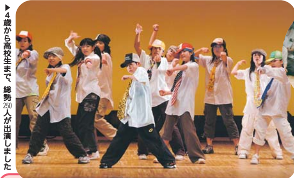
4歳から高校生まで、総勢250人が出演しました

全国の壁は高く 3月20日から、行われた春の高校バレー(全国高等学校バレーボール選抜優勝大会)に県代表として市立船橋高校男女バレーボール部が出場しました。女子は1回戦を突破するものの、2回戦の富山第一高等学校(富山県)との対戦で、セットカウント0-2と敗退。男子は長崎北高等学校(長崎県)を相手に、フルセットまでもつれ込みましたが、あと一歩のところまで敗れベスト16。男女とも全国を相手に健闘しました。