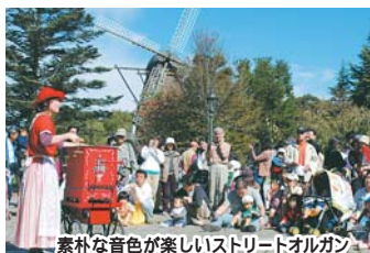
素朴な音色が楽しいストリートオルガン