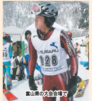
富山県の大会会場

「アイスバーンや荒れたコースに挑むときのスリルがとても好きなんです。自分にとって、かけがえのない最高の瞬間を与えてくれます」