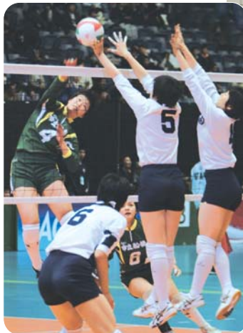
女子1回戦の対人間環境大学岡崎学園高校戦