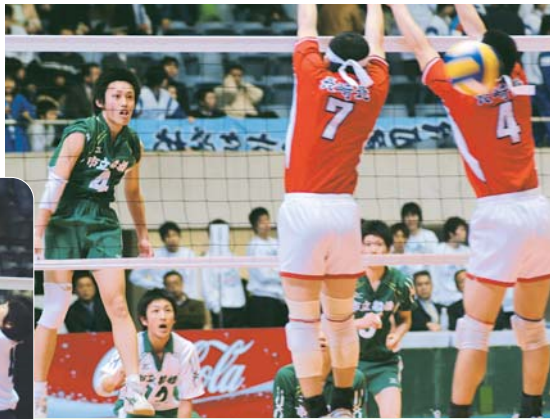
男子1回戦の対長崎北高校戦

全国の壁は高く 3月20日から、行われた春の高校バレー(全国高等学校バレーボール選抜優勝大会)に県代表として市立船橋高校男女バレーボール部が出場しました。女子は1回戦を突破するものの、2回戦の富山第一高等学校(富山県)との対戦で、セットカウント0-2と敗退。男子は長崎北高等学校(長崎県)を相手に、フルセットまでもつれ込みましたが、あと一歩のところまで敗れベスト16。男女とも全国を相手に健闘しました。