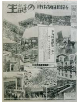
船橋市の誕生を報じた、昭和12年4月1日の号外

なつかしの風景が 2月13日から24日まで、市役所1階美術コーナーで、西図書館所蔵の資料を展示した「目で見る近代の船橋」が行われました。展示されたのは、明治から昭和20年代までの風景写真や絵図、古地図など18点。訪れた皆さんは、埋め立て前の海岸線を写した航空写真や船橋市誕生を報じた新聞の号外など、貴重な資料の数々に、じっと見入っていました。