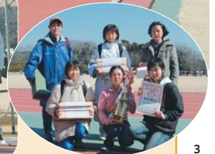
3連覇を果たしたチーム「かもめ」の皆さん

タスキをつないで! 晴天に恵まれた2月11日、小学生・女子駅伝競走大会が、運動公園で開催され、142チームが参加しました。選手の方々は、チームのために1秒でも早くタスキを渡そうと、懸命に走っていました。 優勝チーム 小学生の部(男女とも法典小) 中学生の部(白山中(我孫子市)) 高校生の部(市立船橋高(17年連続)) 一般の部(かもめ(3年連続))