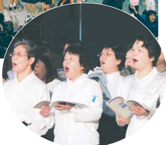
美しいハーモニーで観客を魅了した市民合唱団

シンクロする音の響き! 2月5日、千人の音楽祭が船橋アリーナで開催されました。今年のテーマはシンクロナイズド・ミュージックで、小学生から大人までおよそ2000人の音楽愛好者が出演。市内外からの観客でいっぱいになった会場に、クラシックやポップス、童謡、時代劇のテーマ曲など、幅広いジャンルの演奏や歌が響き渡りました。グランドフィナーレでは、出演者だけでなく観客も合わせた約5000人の皆さんが「船橋ドドンパ」を大合唱。拍手がいつまでも鳴りやみませんでした。