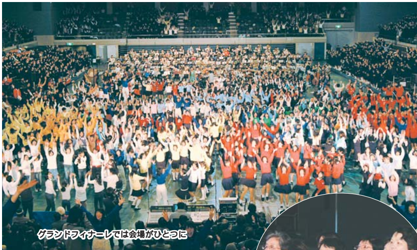
グランドフィナーレでは会場がひとつに

シンクロする音の響き! 2月5日、千人の音楽祭が船橋アリーナで開催されました。今年のテーマはシンクロナイズド・ミュージックで、小学生から大人までおよそ2000人の音楽愛好者が出演。市内外からの観客でいっぱいになった会場に、クラシックやポップス、童謡、時代劇のテーマ曲など、幅広いジャンルの演奏や歌が響き渡りました。グランドフィナーレでは、出演者だけでなく観客も合わせた約5000人の皆さんが「船橋ドドンパ」を大合唱。拍手がいつまでも鳴りやみませんでした。