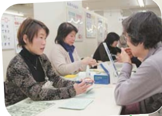
歯科相談コーナーでは、歯の模型を使った歯みがき指導も