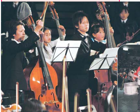
市民合同オーケストラは、重厚な調べのクラシックを披露