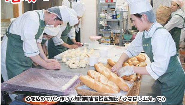
心を込めてパン作り(知的障害者授産施設「ふなばし工房」で)