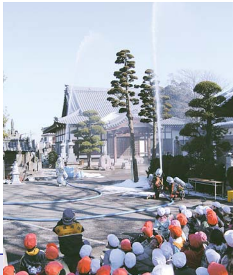
▶本堂に向けて一斉放水を行うと、子どもたちから歓声が