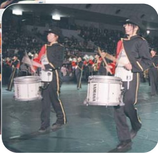
日本一に輝いた法田中学校のマーチングドリル演奏