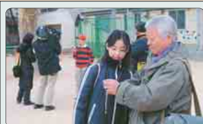
この授業の様子は、NHK総合「課外授業 ようこそ先輩」で3月1日(水)午後11時15分～44分に放送予定です。再放送・3月5日(日)午後1時50分～2時20分 ほか

ちの気持ちが変わるような題名をつけようと、一日中考えていました。とうとう最後の日。写真の題名と、どういう気持ちで撮ったかを発表します。「いつも見守ってくれてありがとう」と感謝を込めた校庭の木の写真。つばみから花が満ちあふれるように咲くのを、卒業から中学生になることに例えた花の写真。どれもすばらしい作品でした。自分の気持ちを声に出したり、紙に書いたりするこもすてきだけれど、写真は見るだけで気持ちや思いが伝わります。3日間はあっという間だったけれど、この体験をいかにして、少しの言葉をそえるだけで気持ちが伝わるような、そんな写真をこれからも撮りたいと思います。先輩、ありがとうございました。