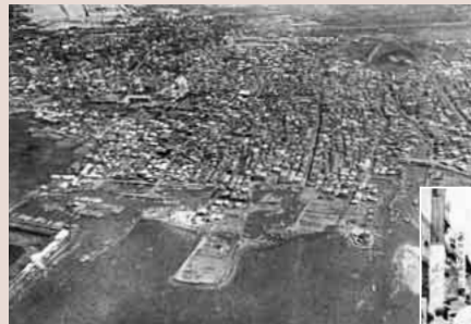
昭和初期の船橋町。埋め立てが進む以前の現在とは異なる海岸線を上空から眺める