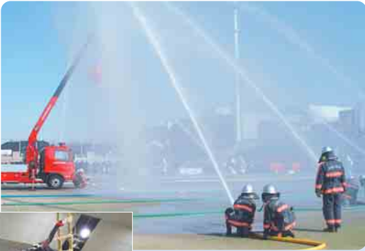
消防職員・団員による一斉放水