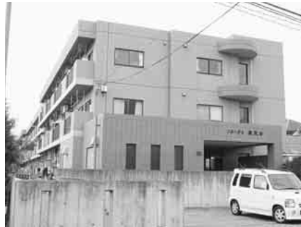
借上住宅「ソル-テ夏見台」(夏見台4)