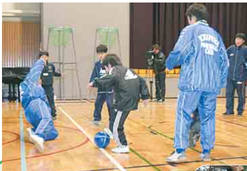
高校生顔負けの「ナイス・フエント」

「どうしたら上手になれるの?」「たくさん食べて、毎日楽しくサッカーをすることだよ」