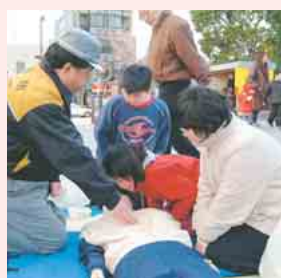
心肺蘇生法の体験 (昨年の防災フェアで)

防災とボランティア週間(1月15日~21日)にあわせて、防災イベントを行います。