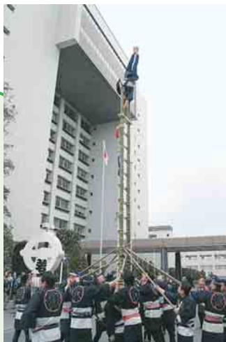
一年間の安全と発展を祈って

新春・梯子乗り 恒例の梯子乗りが市役所前で行われました。披露したのは市鷹(たか)職組合の若手組織「若鷹会」の皆さん。24人。市の指定文化財にもなっている伝統芸能です。鷹口(たかぐち)で支えられた約6.3メートルの梯子の上で両手や両足を離してポーズを決める荒技に、約100人の観客が大きな歓声と拍手を送っていました。