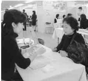
歯の健康相談(昨年のフェアで)

〈日時〉1月26日(木)~31日(火) 午前10時~午後7時30分 31日は午後5時まで 入場無料 〈会場〉東武百貨店船橋店 6階イベントプラザ