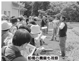
船橋の農業も視察

活動内容研修会、アンケート、情報誌の配布など 対象市内在住の20歳以上の人 募集人数50人(多数は選考) 謝礼1万2000円以内 交通費なし 任期4月から1年間 申込み2月6日(月)(消印有効)までに、申込用紙に必要事項を書き、直接または郵送で消費生活課(〒273-8501 住所不要☎436-2482)へ 募集案内等は同課、各出張所・公民館・図書館、消費生活センターで配付