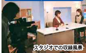
スタジオでの収録風景

ふなばしCITY NEWS 毎週土更新 毎日午後0時30分~、7時30分~ 1/14(土)~成人式 ほか 1/21(土)~市民駅伝競走大会 ほか 1/28(土)~防災フェアふなばし ほか 2/ 4(土)~ヘルシー船橋フェア ほか