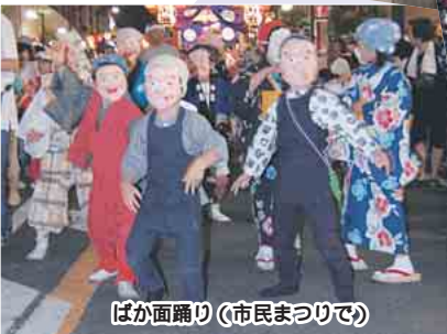
ばか面踊り(市民まつりで)