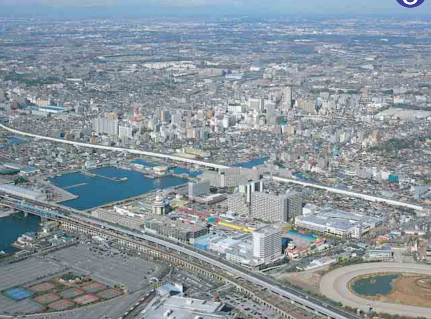
ららぽーと上空から中心市街地を見る