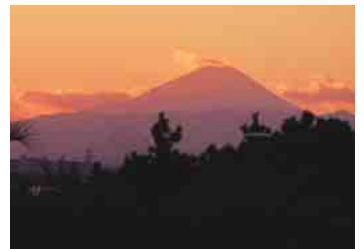
海浜公園の芝生広場から