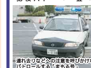
連れ去りなどへの注意を呼びかけながらパトロールする「まもる号」