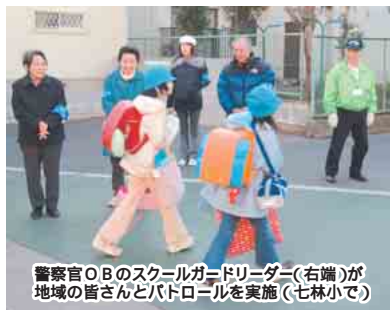
警察官OBのスクールガードリーダー(右端)が地域の首さんとパトロールを実施(七林小で)

奈良県や広島県、栃木県で小学1年生の児童が犠牲になる痛ましい事件が相次いでいます。 平成17年上半年、全国で小学生が被害にあった事件は、殺人・傷害致死が13件、略取誘拐が47件、強制わいせつが537件に上りました。