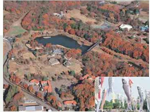
アンデルセン公園