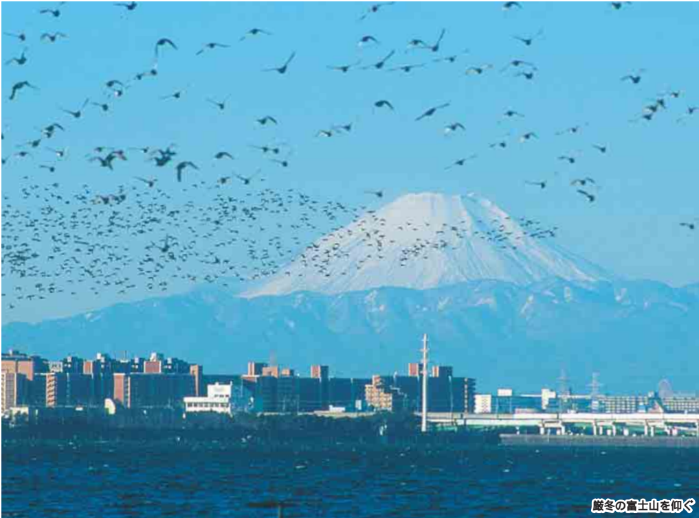
厳冬の富士山を仰ぐ