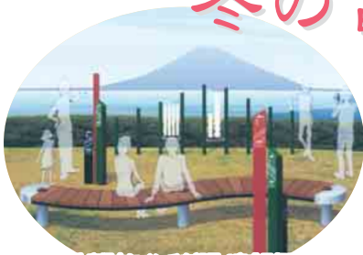
芝生広場内にベンチを設置(完成予想図)