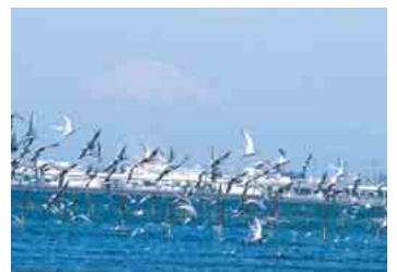
春霞。アジサシが舞う