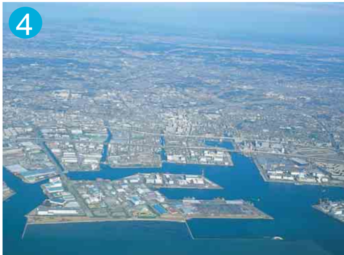
市南部地域(写真手前中央:三番瀬海浜公園)