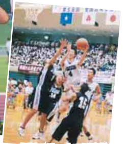
船橋アリーナでは高校ナンバーワンを決める激戦が