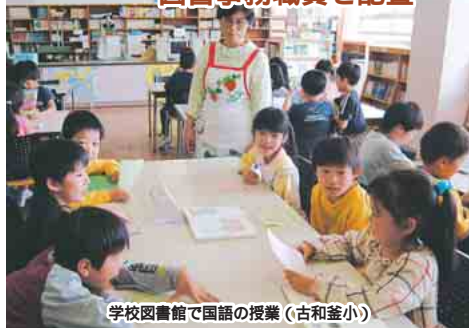
学校図書館で国語の授業(古和釜小)

読書のアドバイスや貸出し業務を行う図書事務職員を、市立の全小学校に配置。学校図書館での授業や休みの時間の利用がいつでも可能となりました