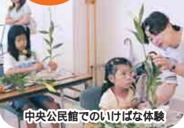
中央公民館でのいけばな体験

毎月第3土曜日を、「ふなばしハッピーサタデー」の日に。公民館と地域の皆さんと一緒に、子どもたちが文化やスポーツ、ボランティア活動に親しめる環境づくりを行っています