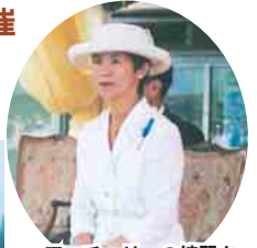
アーチェリーの練習を見学される高円宮妃殿下