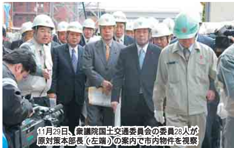
11月29日、衆議院国土交通委員会の委員28人が原対策本部長(左端)の案内で市内物件を視察

建築物の構造計算書偽造問題では、市内で耐震基準に満たないマンションがあることがわかりました。市では、11月18日、対策本部を設置し、入居者の移転への支援や、建物周辺の安全確保などの対策を進めています。