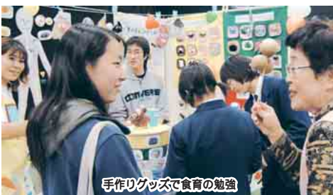
手作りグッズで食育の勉強

「ふなばし健やかプラン21」スタートを記念して、今年初めて開催された健康まつり。食や医療、スポーツなど、市民団体が運営する健康に関する様々な展示ブースや体験コーナーなどに、約1万人の皆さんが集まりました。4面に子ども記者によるレポートがあります