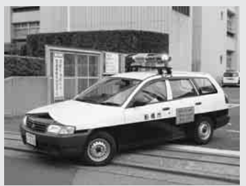
パトロールに出発する「まもる号」

市では、昨年4月に市民防犯課を設置。犯罪を未然に防ぐために、町会・自治会、警察、市民による犯罪発生情報の提供、地域の自主的な防犯パトロール隊への防犯物資の支給などを実施しています。 市民安全パトロールカー(「まもる号」みはるご)や公用車による防犯パトロールをはじめ、フリーリを進めています。 市では、今後も、犯罪のない住みよいまちづくりを進めていきます。