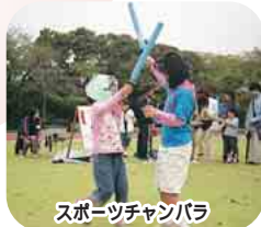
スポーツチャンバラ