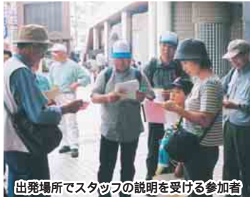
出発場所でスタッフの説明を受ける参加者

▶ウォークラリー 下記の12駅から運動公園を目指して歩きます 当日受付 出発場所船橋駅北口、東船橋駅北口、前原駅、菜園台駅、北習志野駅西口、高根公園駅、滝不動駅、三咲駅、二和向台駅、塚田駅西口、馬込沢駅西口、飯山満駅 各駅に小旗を持ったスタッフが待っています 出発時間午前9時～10時に随時 雨天決行 費用300円(小・中学生100円)