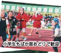
小学生もばか面おどりで歓迎