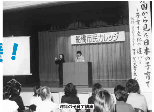
昨年の子育て講座