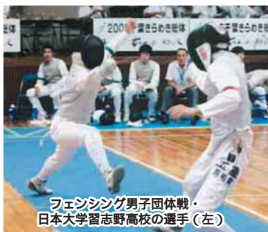
フェンシング男子団体戦・日本大学習志野高校の選手(左)