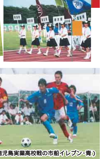
サッカー(対鹿兒島実業高校戦の市船イレブン・青)