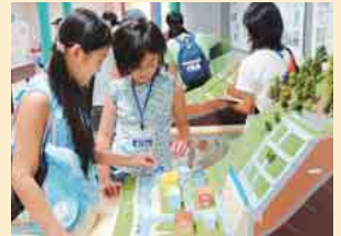
土砂崩れを防ぐにはどうするの？