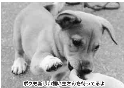
ボクも新しい飼い主さんを待ってるよ

勤労者美術展の作品を募集 仕事の合い間に 芸術に挑戦しませんか 今年で、33回目を迎える 勤労者美術展。この美術展 では、市内に職場・住所の ある勤労者が、余暇に創作 した絵画や書、写真などを 発表できます。テーマは自 由。皆さんも応募してみま せんか。 〈日時〉12月15日(木)～18日 (日)午前10時～午後6時 最 終日は午後4時まで。(月休) 〈会場〉市民ギャラリー 市民館・図書館で配付