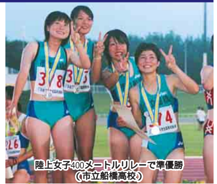
陸上女子400メートルリレーで準優勝(市立船橋高校)