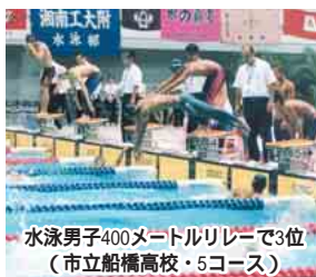
水泳男子400メートルリレーで3位(市立船橋高校・5コース)