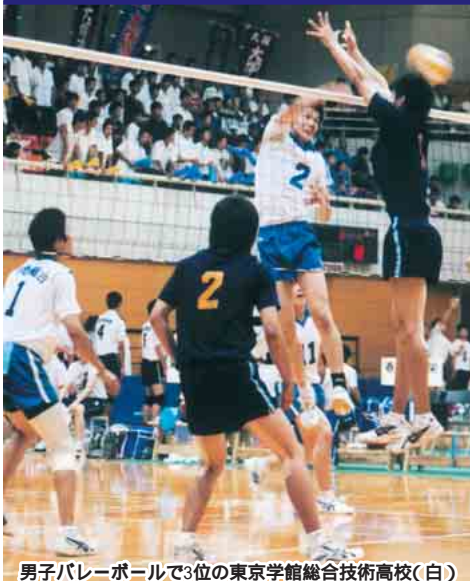
男子バレーボールで3位の東京学館総合技術高校(白)