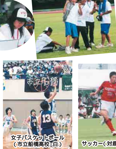
女子バスケットボール(市立船橋高校・白)