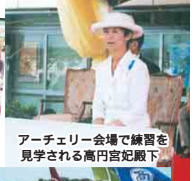
アーチェリー会場で練習を見学される高円宮妃殿下