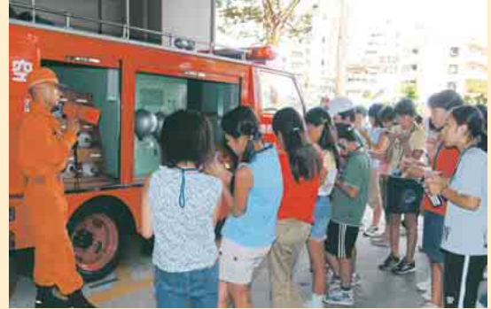
中央消防署で、様々な消防自動車について説明を受ける子ども記者

8月22日、小学6年生と中学2年生の子ども記者58人が、「災害に強いまちづくり」をテーマに、国土交通省船橋防災センターや市災害対策本部、消防指令センターなどを見学。市の防災対策について学びました。