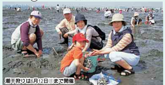
潮干狩りは6月12日(日)まで開催