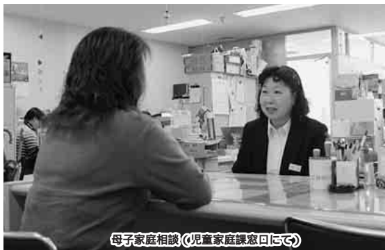
母子家庭相談(児童家庭課窓口にて)

近年、離婚等の理由により、誰もがいきいきと安心して母子・父子家庭が暮らし、暮らせる生活環境をめざしています。こうした、ひとりを基本理念に、6つの親家庭の親たちは、子育ての柱を設定しています。と生計の担い手という二つの役割を果たさなければならず、経済面や健康面などで、様々な困難に直面する場合があります。 計画では、「母子家庭等の」とい、それぞれの柱に、就業や生活、子育てなどの多様な相談に対応するための相談機能の充実や、夜間・休日相談の推進、や