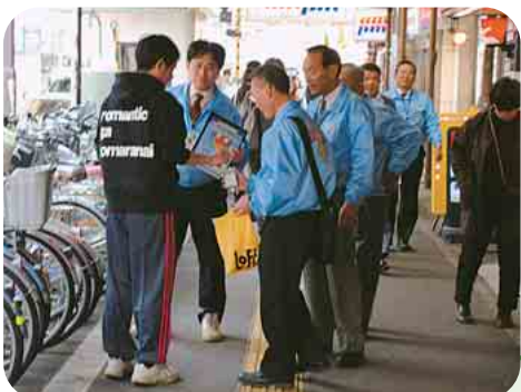
路上喫煙ができないことを指導する美まもりパトロール隊員