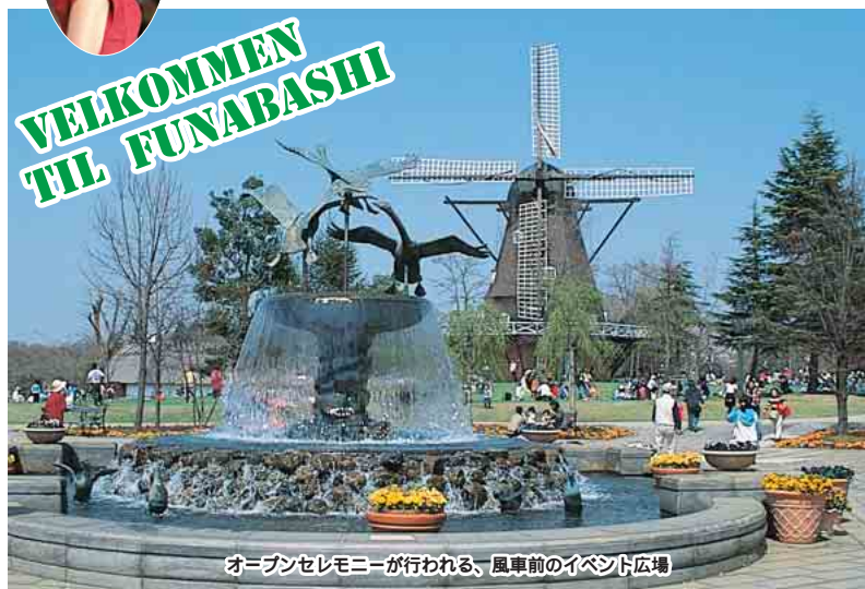
オープンセレモニーが行われる、風車前のイベント広場

4月23日、アンデルセン公園子ども美術館に、「アンデルセンスタジオ」がオープンします。それに先立ち19日に行われるセレモニーには、デンマーク王国のメアリー皇太子妃が出席。オープン間近のスタジオを見学し、船橋の子どもたちとふれあいます。皆さんも一緒にお祝いしませんか。