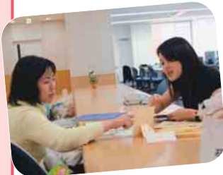
健康に関する様々な相談に応じます(西部保健センターで)