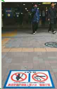
路上喫煙、ポイ捨て等防止重点区域を示す路面標識(JR船橋駅前)

美まもり隊出動! 路上喫煙とポイ捨ての防止を強化するため、市では、4月1日から新たに「美まもりパトロール隊」を結成し、船橋駅周辺の重点地区で巡回指導を始めました。また、この日から、勧告に応じない違反者に対し、2000円の過料徴収も始めました。美しく快適なまちづくりのため、今後、美まもりパトロール隊は、不法駐輪や屋外広告物の取り締まりにもあたります。