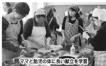
ママと胎児の体に良い献立を学習

初めて出産する人のための教室です。 会場・日程 中央保健センター☎423-2111⇒5月12日、19日、26日各(木) 西部保健センター☎047-302-2626⇒5月9日、16日、23日各(月) 東部保健センター☎466-1383⇒5月19日、26日、6月2日各(木) 時間午前9時30分～正午(中央保健センターのみ) 午後1時15分～3時45分 内容下表 対象17年9・10月に出産予定の人 申込み希望する各保健センターへ