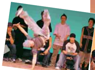
音楽に合わせた即興の踊りで勝敗を決する中高生ダンスバトル