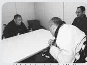
障害者自立のための無料相談 (船橋駅前総合窓口センター相談室)

☐上記相談員や、各障害福祉団体が無料で、身体・知的などの様々な障害に関する相談を、フェイス5階相談室で行っています。日程・申込み方法などは、毎月1日号の無料相談窓口(7面)をご覧ください。