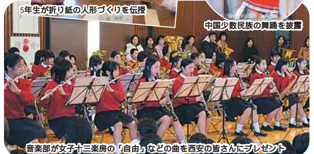
音楽部が女子十三楽房の「自由」などの曲を西安の皆さんにプレゼント