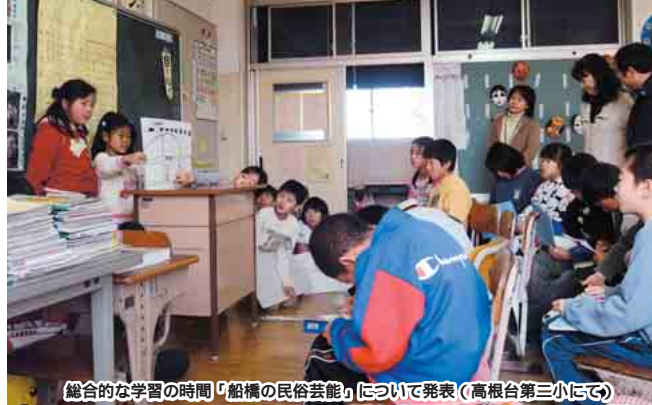
総合的な学習の時間「船橋の民俗芸能」について発表(高根台第三小にて)