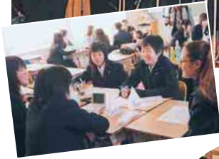
英会話の授業にも参加