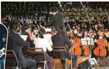
「木星」を演奏する市民合同オーケストラ