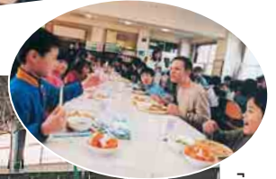
「あはれはこしんやいしんやいせむら」