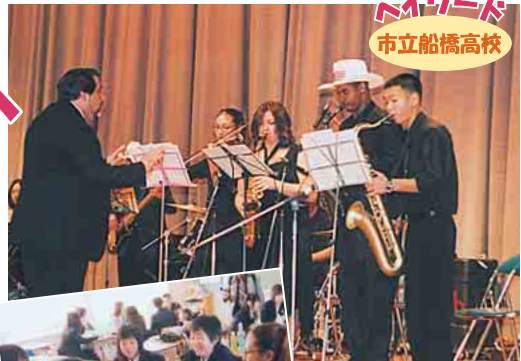
ハイワード市立船橋高校