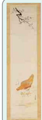
柴田是真「梅花・鶏」

ふなばしCITY NEWS 毎週土更新 毎日午後0時30分～、7時30分～ 2/19(土)～女性消防団員フォーラムほか 2/26(土)～僕らは森の探検隊ほか 3/5(土)～中央卸売市場見学・料理教室ほか