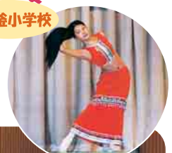
中国少数民族の舞踊を披露