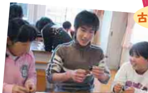
5年生が折り紙の人形づくりを伝授