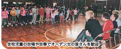
全校児童の合唱や合奏でオーデンセの皆さんを歓迎