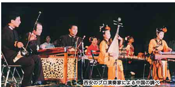
西安のプロ演奏家による中国の調べ