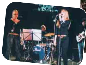
オーデンセ市音楽学校の皆さんによるジャズの演奏