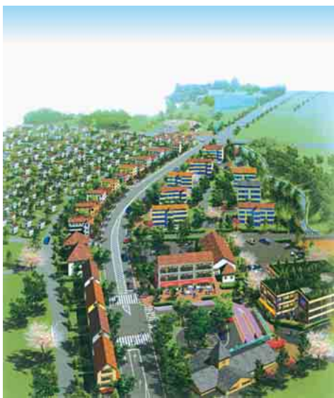
将来の完成予想イメージで実際と多少異なります