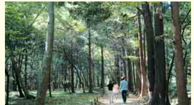
スズメ、サクラ、ケヤキなど樹木が豊富な明るい森。湧き池や竹林などもあり変化に富んでいる(⑥)

二重川の流れるこのコースは、雑木林、湿地、県民の森など豊かな水と緑に囲まれています。四季折々に変化する、水辺ならではの草花や生き物に目を向けながら歩いてみませんか。