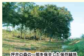
坪井の森の一部を保全した保存緑地

た。しかし、「環境と共生するまちづくり」という市や都市再生機構の取り組みを知り、地元の私たちが見届けていきたいと思い、この活動を始めました。現在会員数は25人。毎週火曜日に、保存緑地の手入れや植物の移植、観察会などを行っています。新しくできるまちに住む皆さんも、この坪井の自然を大切に思い、活動に参加してくれたらいいですね。