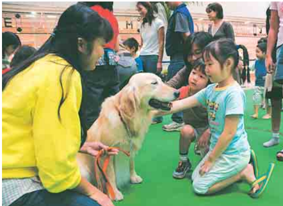
▲大きな犬でも、ちゃんとさわってあげれば大丈夫

正しく飼って仲良く共生 9月25日、ららぽーとウエストコートで「なかよし動物フェスティバル in ふなばし」が開催されました。犬の手入れやしつけの実演、獣医師による相談などが行われ、子どもたちは習ったばかりの「正しいさわり方」で、犬とコミュニケーション。訓練された警察犬のりりしい模範演技には、会場から大きな拍手がわきました。