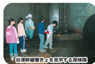
谷津幹線管きよを見学する探検隊

市「きれいになった水は川 や海に流れているほか、処 理場のトイレの水として再 利用しています。また、処 理場の中に出た汚泥(汚れた 水の中で沈んだドロ状のご み)も、肥料として生まれ 変わって、私たちの生活の中 に戻ってくるんだよ」