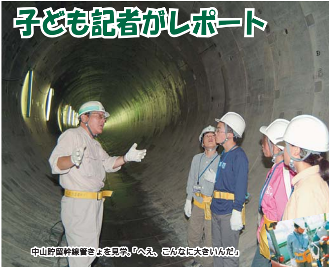
中山貯留幹線管きよを見学。「へえ、こんなに大きいんだ」