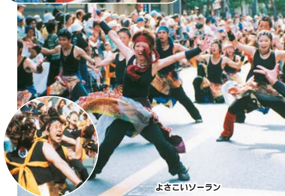
よさこいソーラン