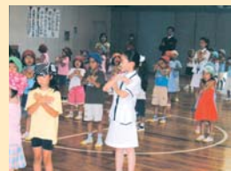
踊りで歓迎(葛飾小で)