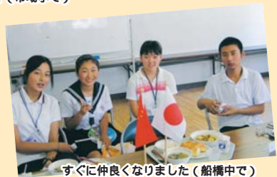
すぐに仲良くなりました(船橋中で)