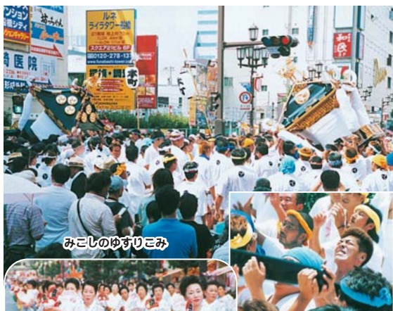
みこしのゆすりこみ