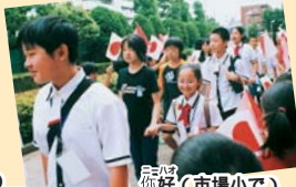
手紙は、你好(市場小で)