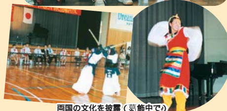
両国の文化を披露(葛飾中で)