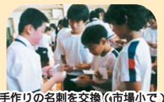
手作りの名刺を交換(市場小で)