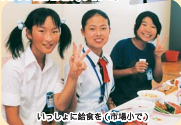
いっしょに給食を(市場小で)