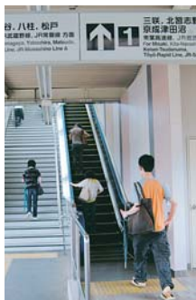
▶ 新京成線二和向台駅のエスカレーターとエレベーター