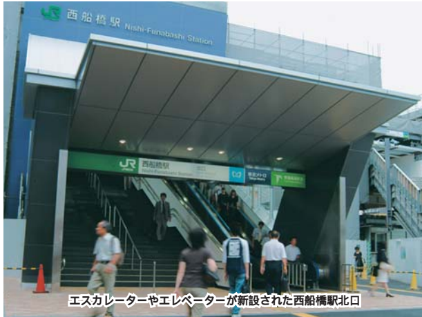
エスカレーターやエレベーターが新設された西船橋駅北口

た。そのため、高齢者や障害者、ベビーカーの利用者などに不便で、改修の要望が多く寄せられていました。新しくなった北口の階段には、屋根のほか、エスカ