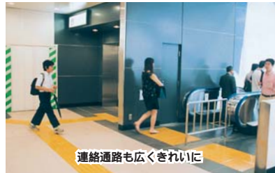
連絡通路も広くきれいに

レイター上下各1基とエレベーター1基を設置。高齢者や体の不自由な人も安心して駅を利用したり、南側への通り抜けができるようになりまし