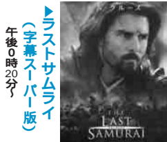
ラストサムライ (字幕スーパー版) 午後0時20分