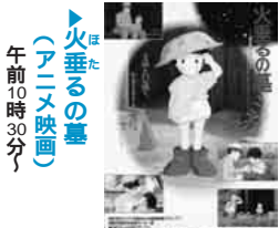
火垂るの墓 (アニメ映画) 午前10時30分