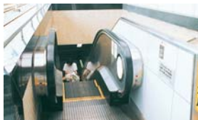
東京メトロ東西線原木中山駅のエスカレーター