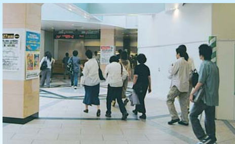
武蔵野線への連絡通路も新設されました

JR西船橋駅では、市が補助しているエレベーターやエスカレーターなどの設置に併せて、駅舎の改修を行っています。コンコースの拡充をはじめ、車いす利用者やオストメイト(人工肛門・膀胱造設者)などに対応する多機能トイレの新設、武蔵野線への連絡通路の拡張などで、今年度中にはおおむね工事が終了し、より快適で利用しやすい駅に生まれ変わります。