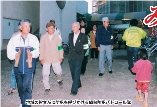
地域の皆さんに防犯を呼びかける緑台防犯パトロール隊