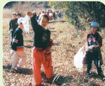
「どんぐり授業」のお礼に、金杉台小学校の3年生が、ごみ拾いのお手伝いを...

斜面林と田んぼという懐かしい里山の自然が残る金杉地区。ここで高根フレンド「みちくさ」は発足以来10年間、ごみ拾いや森の手入れなどのボランティア活動を続けています。