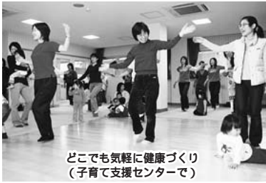
どこでも気軽に健康づくり (子育て支援センターで)

市では、市民一人ひとりが自ら健康づくりに取り組めるよう(仮称)「ふなばし健やかまちづくりプラン21」の策定を進めています。今回、皆さんの意見をプランに反映させるため、素案を公表します。 健康政策課 ☎436・2413 このプランでは、市民が健康に関する意識を高め、自ら健康づくりに取り組める方策を示します。市や関係機関は、そのための環境づくりを進めます。 人と人とのつながり 健康づくりを楽しく長く続けるには仲間や友達が必要です。素案では、地域