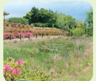
平成11年に栄町の工場内に設けられた「第1トンボ池」

「クボタ船橋の森」と名付けられた緑地とトンボ池。水道管などの铸铁管を製造し、地球環境に配慮した企業活動を目指す㈱クボタ京葉工場(栄町2・高瀬町)のシンボルです。緑地には80種類を超える様々な木々が植えられ、中には珍しいキンラン、ギンランなども...。また、従業員が作った2か所の「トンボ池」には、現在、21種類のトンボやメダカのほか、かわいらしいカルガモ親子も住みついています(見学希望者は、同工場☎431-6278までお問い合わせください)。