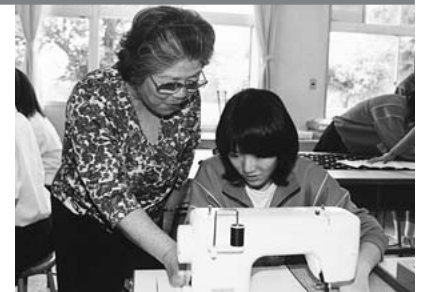
市民ボランティアによる洋裁の授業(高根中で)