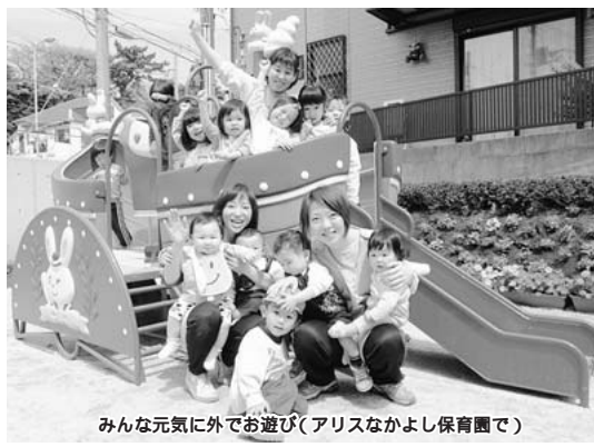
みんな元気に外でお遊び(アリスなかとよし保育園で)

日曜日や祝日に保育を行う休日保育を、アンデルセン第二保育園と西船みどり第二保育園と西船みどり