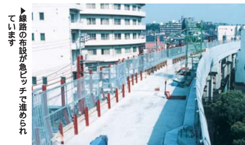
線路の布設が急ピッチで進められています