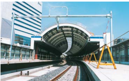
幕屋根に覆われた、新しい京成船橋駅のホーム。右側が上り線

京成船橋駅と大宮宮下駅が高架駅になります。京成船橋駅は、3階構造になり、2階部分が改札口・コンコースで、19年度末にはフェイス(船橋駅南口再開発ビル)の自由通路とつながり、JR船橋駅との行き来がスムーズになります。