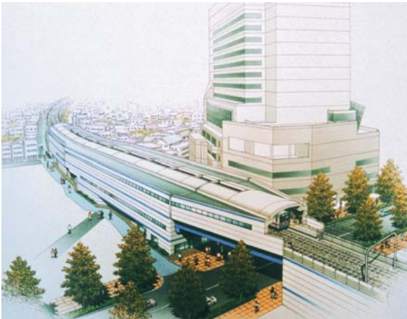
京成船橋駅周辺の完成予想図

慢性的な交通渋滞の解消のため、高架化を進めている京成本線の連続立体交差事業。市でも、JR船橋駅南口再開発と並ぶ、市の表玄関の整備に関わる重要な施策として、長年にわたり事業主体である県や、京成電鉄とともに取り組んでいます。建設工事は、大詰めを迎え、今年12月には上野方面への上り線が完成し、踏切の遮断時間が半減します。