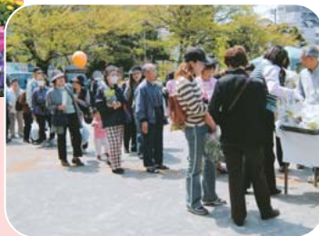
観葉植物の無料配布は、すぐに品切れの大人気

春、らん漫 の4月16日から18日、緑と花のジャンボ市が天沼弁天池公園で開催されました。今年は春らしい好天が3日間続き、会場の草花もさらに色鮮やかに…。バラの苗木やマリゴールドなどの花々の即売会のほか、市民が花壇づくりに挑戦するコーナーやフラワーアレンジメントの体験講座も催されました。会場に訪れた大勢の皆さんは、鉢を手にとり熱心に品定めをしていました。