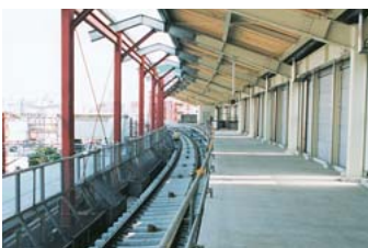
大宮宮下駅の上り線ホームも完成間近です

高架下の有効活用を 高架線の北側には20年度末までに、幅6メートルの道路を整備します。また、高架化されて生まれる高架下スペースについては、県や京成電鉄と協議して利用方法を決めます。市では、自転車駐輪場や、防災倉庫・防火水槽、公衆トイレなどに活用できるように要望していきます。