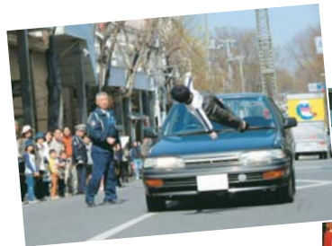
◀ダミー人形による衝突実験