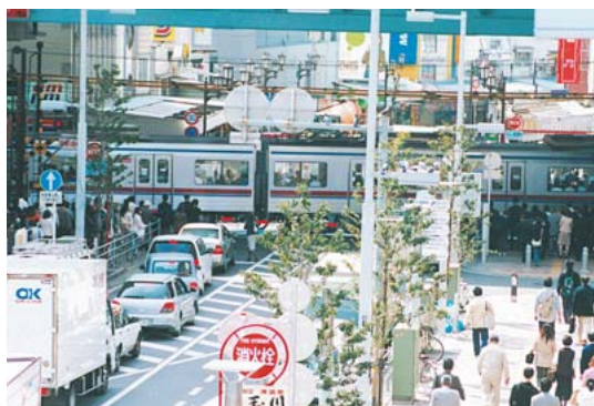
現在の京成船橋駅前の踏切。朝夕の通勤時には1時間あたり30分も遮断機が閉まっています。間もなくこの光景も記憶の中に...