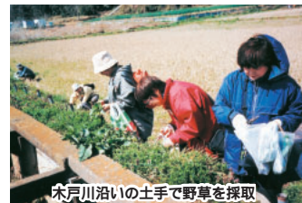
床戸川沿いの土手で野草を採取

【休館日】 毎月最終(月、祝) 薬台公民館 ☎469-4535 ・野草の採取と調理 3月17日(水)、19日(金)各午前9時~午後2時/行き先古和釜方面/各先着30人/事前に費用100円を添えて申し込み 交通費別途