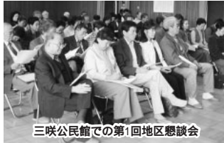
三咲公民館での第1回地区懇談会

市では、16年度末の完成を目指し、地域福祉計画の策定を進めています。昨年開催した第1回地区懇談会に続いて2回目となる今回は、各地区で地域ぐるみの福祉活動を