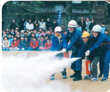
初めて使う消火器におっかなびっくり

貴重な文化財を守ろう 1月26日の文化財防火デーにちなんで市内4か所で消防訓練が行われました。1月27日に行われた船橋大神宮の訓練では、灯明台(県指定文化財)からの火災を想定し、大神宮職員や地元自治会による初期消火訓練や応急救護訓練、消防団や消防署員によるポンプ車からの一斉放水が行われました。また、峰台・湊町小学校の児童およそ170人も参加。消火器の使い方や起震車体験なども行われ、防災について熱心に学んでいました。