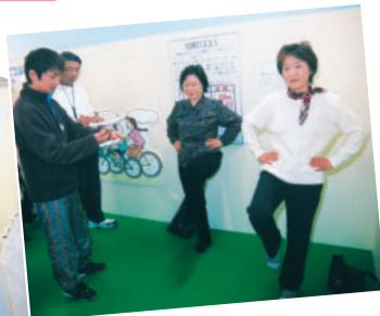
▲片足で何秒立っていられますか? (体力測定コーナー)

ヘルシー船橋フェア が1月29日~2月3日まで、東武百貨店船橋店6階のイベントプラザで開催されました。今年のテーマは「みんなでつくろう『健康ふなばし21』」。各種相談や血液検査、骨密度測定、体力測定などに多くの皆さんが詰めかけました。市医師会による禁煙をテーマにした講演や肩こり改善のための体操などのイベントも行われ、熱心にメモを取る姿が見られました。