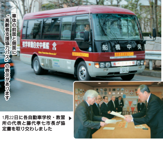
「高齢者支援協力バス」の表示があります

65歳以上の高齢者が無料で利用できます 「高齢者支援協力バス」は、市内4つの自動車学校・教習所(船橋自動車学校・船橋第一自動車教習所・津田沼自動車教習所・船橋中央自動車学校)の協力で運行します。65歳以上の人は無料で、教習生を送迎するバスに相乗りできるようになります。 運行は、原則(月)～(金)午前8時～午後6時の間で、運行間隔は各コースともおおむね1時間ごとです。なお、(土)日(祝)と、各学校・教習所が休みの日は利用できません。 コースは市内5コースで、各学校・教習所の送迎バス運行コースと、その一部です(各コースが、乗降場所については2面参照)。 利用するには「バスカードが必要」です。バスを利用するには、事前に申請を行い、「交通不便地域」の解消に向けて