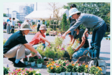
広さ約1平方メートルの花壇に草花をならべます (昨年市民花壇で)

毎日先着100人にミニ観葉植物をプレゼント。 日時 10月17日(金)~19日(日) 午前9時30分~午後4時30分 会場 天沼弁天池公園 内容 観葉植物・種苗・肥料等の即売 緑の相談コーナーほか ☐期間中会場に展示する市民花壇づくりの参加者 を募集 対象市内在住の2人以上のグループ 募集数5組(多数は抽せん) 申し込み 10月7日(火)までに同事務局へ 花壇づくり用草花は同事務局で用意します。また、催し終了後使った草花は持ち帰ることができます