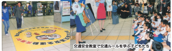
交通安全教室で交通ルールを学ぶ子どもたち

▲「今あるのは、こぼちゃん(妻)のおかげです」と語るエムさん(中央)。愛犬のアーリナも大事な家族の一員