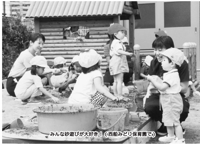
みんな砂遊びが大好き!! (西船みどり保育園で)