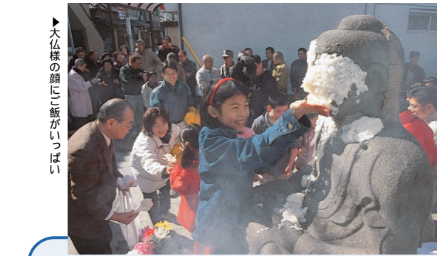
大仏様の顔にご飯がいっぱい