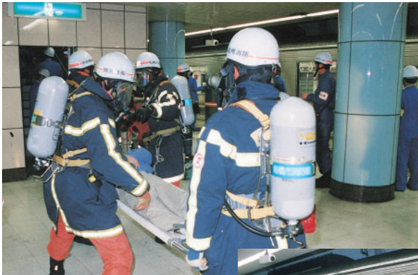
消防ホースを持って車両内へ突入 重傷者を担架で安全な場所へ