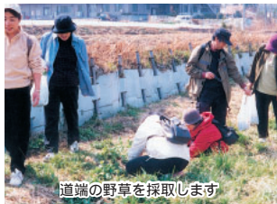
道端の野草を採取します

・子どもまつり 3月2日(日)午前10時～午後3時/人形劇、模擬店、餅つき、遊びのコーナーほか/当日自由参加 ・子ども映画会 3月8日(土)午前10時～午後1時30分～ / 「ちびまる子ちゃん」「ドン松五郎の生活」/当日自由参加 ・野草の採取と調理～自然と親しむ～ 3月18日(火)・19日(水)各午前9時～午後2時/行き先古和釜方面(交通費実費)/各先着30人/費用100円を添えて申し込み