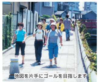
地図を片手にゴールを目指します

日時3月8日(土)午前10時各スタート地点集合 雨天中止 コース 町並みと海を知るコース(JR船橋駅北口おまつり広場スタート) 渡り鳥観察コース(青少年会館スタート) ゴールはいずれも青少年会館。ゴール後に豚汁とゲーム&ニューススポーツ体験有り 定員各コース先着50人 費用400円 中学生以下は100円 申込み青少年会館☎434-5891へ(月休)