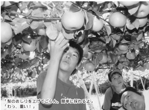
「梨のおしりを上げてごらん。簡単に採れるよ」「わっ、重い！」

小・中学生合わせて6人の児童・生徒記者が、市内の農業を体験取材してきました。船橋では、生産高が県内3位の梨をはじめ、ニンジンや小松菜、牛乳や卵、花などの農産物を作っています。都市化が進む中で、近隣住民との関係、食の安全などの問題に直面しながら、おいしい農産物を提供しようとがんばっている生産者の姿をご紹介します。