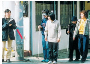
アイマスクをして歩く実習

日時3月6日(水)、7日(金)、12日(水)午前10時～午後3時 内容ガイドヘルプの実技体験、視覚障害者の講話など 対象3日間参加できる市内在住、在勤の人 定員先着16人 申込み身体障害者福祉センター☎466-1268、☎466-1269へ