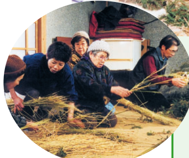
自宅の戸口にかざる小蛇をつくる 地元の皆さん

無病息災を願って 疫病や魔物が村を守る伝統行事「辻切り」が、2月2日に八坂神社(中野木1)で行われました。地元の皆さんがワラで作った一対の大蛇を神社に奉納。その後、守り神として、村の東西の樹木に巻きつけ、今年一年の無事を祈りました。市の無形文化財にも指定されているこの行事は、毎年、2月の初午の日に行われています。