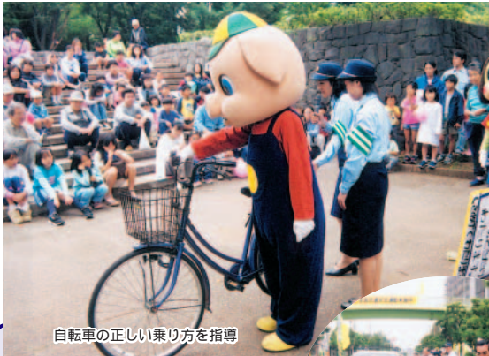
自転車の正しい乗り方を指導