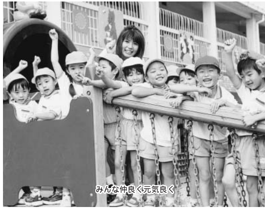
みんな仲良く元気良く

〈申込み〉10月25日(金)(消印有効)までにハガキに住所、親子の氏名・性別、電話番号、お子さんの学年を書いてみどり推進課(〒273-8501 住所不要)へ