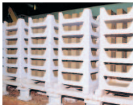
▲1150度の温度で約30時間焼き固められ完全に無害化した焼結品。これが用途に合わせて破碎され骨材ができます