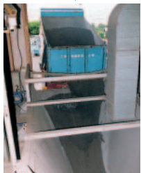
▲焼却灰が再資源化施設に運ばれます

▶透水性ブロック用に細かく破碎された骨材。業者に委託しブロックになります。小さい写真は路盤材として破碎したものの