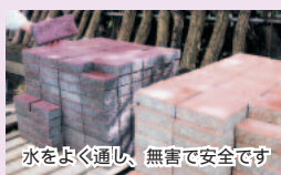
水をよく通り、無害で安全です

大きさ幅10cm×長さ20cm×高さ6cm 価格1個65円 消費税別。直接取りに来られる人に限ります。なお数が多い場合はご相談ください 問合せ(財)市環境公社(北部清掃工場内) ☎457-4084