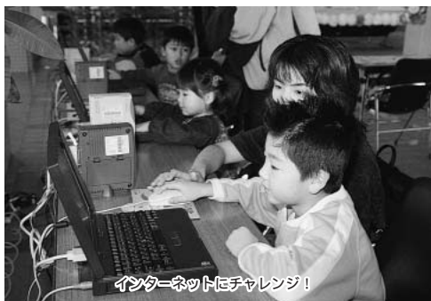
インターネットにチャレンジ!

〈日時〉11月2日(土)、3日(祝)午前9時30分～午後4時 〈会場・問合せ〉総合教育センター ☎422-7730