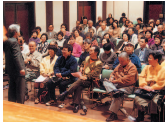
中央カレッジで行われた昨年の講演「現代人が抱えるストレスとケア」