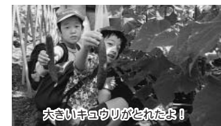
大きい時ウウリがとれたよ!

日時10月12日(土)午前9時~ 内容 野菜の収穫体験ほか 対象小学生の親子二人一組 定員15組(多数は抽せん) 費用一組500円 申込み9月13日(金)(必着)までに往復ハガキに住所、二人の氏名・年齢、電話番号を書いて農水産課(〒273-8501住所不要) ☎436-2492)へ