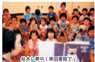
絵本に夢中(東図書館で)

9月15日(祝)は開館 ▶北図書館「えほんの会」 9月5日(木)午前11時~ / 絵本の読み聞かせと紹介 / 2~4歳児と保護者 ▶本とおはなしの会 (9月)