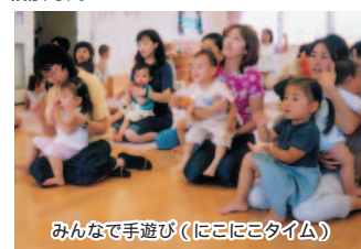
みんなで手遊び(にこにこタイム)

▶子育て相談 随時 / 保育士、心理発達相談員、看護師、栄養士による、育児や発達についての電話・来所相談