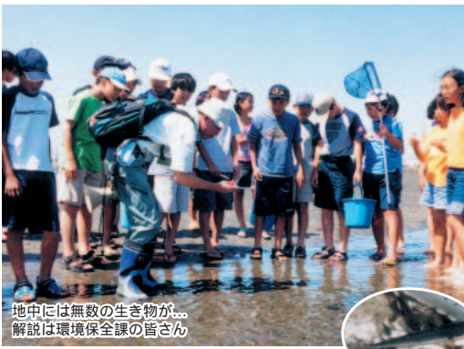
地中には無数の生き物が...解説は環境保全課の皆さん ▶ボラの稚魚やハゼなど。三番瀬は生き物のゆりかご

あとがき 淡いエメラルドグリーンに染まった海。子ども記者が三番瀬を見学した8月20日は、台風13号の影響で大規模な青潮が発生した日でした。子どもたちは、一見美しく見える青潮が恐ろしい死の海であることに驚いていました。 漁業協同組合では翌21日、ふおっとニュースで紹介したとおり、海底から空気を送り青潮の侵入を防ぐ実験を開始。どの