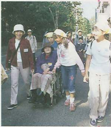
▲ウォーキングを楽しみながら元気良く会場へ

車いすウォーキング フェスティバルが10月27日、船橋アリーナで開催され、障害者80人を含む700人が参加しました。「日ごろ外出する機会の少ない車いすの人に、まちを自由に散歩してもらいたい」と、同フェスティバル実行委員会(西山尚美委員長)が主催したもので、今年で4回目。今回初めてヘリコプターに乗っての空中ウォーキングも行われ、約180人が500メートル上空から船橋の街並みや東京湾を眺めました。