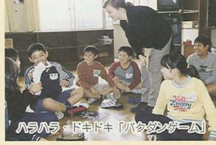
ハロウィン・ドキドキ「バクダンゲーム」

私は去年合唱だけじゃ物足りないなと思っていましたが、3年生の合唱を聴いて声だけでも楽しめるんだとわかり、今年がんばりました。去年より声も大きくなったし、強弱も出ていて2年生らしく歌えたと思います。そして私のクラスは優秀賞をもらえました。来年は、最優秀賞をとれるようにクラスみんなでがんばりたいと思います。