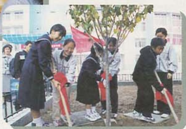
▲永遠の友情を願って3校で記念の植樹 (写真は10月29日、育才中学校)