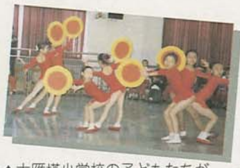
▲大雁塔小学校の子どもたちが中国舞踊を披露。行く先々で歓迎を受けました (10月30日)