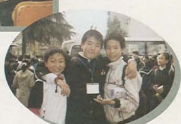
▲西安の生徒はフレンドリーですぐに話しかけてきます (10月29日、育才中学校で)