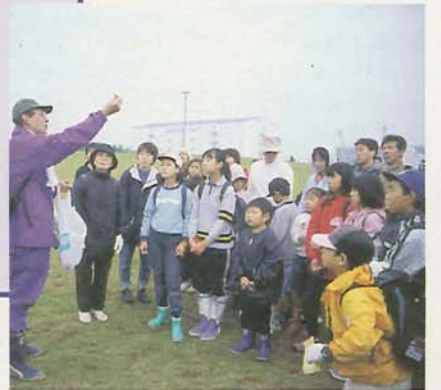
水辺にすむ生き物の説明を受ける皆さん

三番瀬クリーン 大作戦が、10月28日に行われました。あいにくの小雨の中、約750人が参加し、2時間の清掃活動で集められたゴミの量は約1.4トン。その後、野鳥や水辺の生き物の観察会が行われ、きれいになった三番瀬の自然を満喫する姿が見られました。