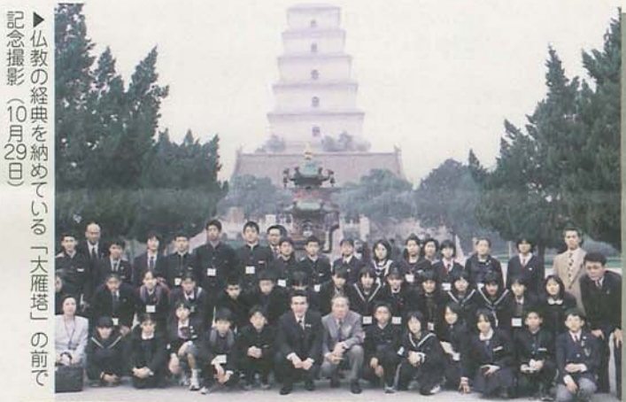
▶仏教の経典を納めている「大雁塔」の前で記念撮影 (10月29日)