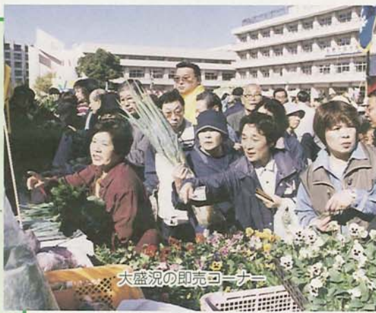
大盛況の即売コーナー

が11月3日にJR船橋駅北口おまつり広場で、4日に市場小学校で開催されました。船橋の農業を身近に感じてもらおうと毎年行われるこの催し。即売コーナーには地元の新鮮な農産物を求めて大勢の人が集まり、普段できない乳しほり体験などに子どもたちは大喜びでした。