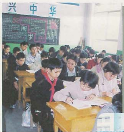
▲第八十五中学校で英語の授業を体験 (10月30日)