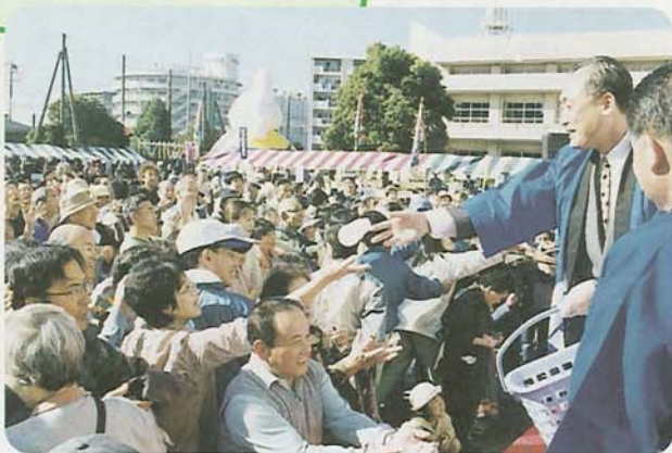
会場の皆さんにもちの振る舞い