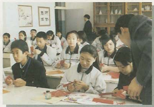
▲育才中学校の美術の授業。色紙を使って切り絵を作りました (10月29日)