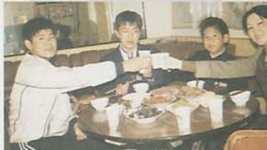
◀二人一組で昼食の時に家庭を訪問。言葉は通じなくてもすぐに仲良しに (10月29日)