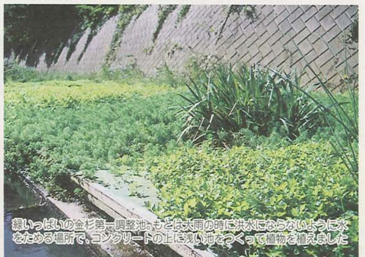
緑いっぱいの金杉第一調整池。もとは大雨の時に洪水にならないように水をためる場所で、コンクリートの上に浅い池をつくって植物を植えました

わたしたちが住んでいる船橋市では、海老川の上流で、自然の力を利用して水をきれいにする実験をしているんだそうです。わたしたち子ども記者は、さっそく実験場所の金杉第一調整池に向かいました。