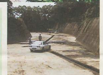
実験前の写真も見せてもらいました。生物はまったくいなかったそうです。(12年4月撮影)