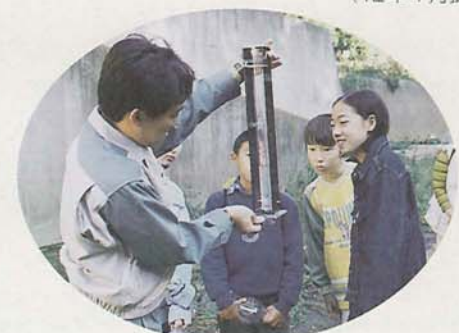
透視度計を使って、水の汚れを測定

年に数回カーボンファイバーを交換したり、植物の手入れをするだけなので、お金もあまりかかりません。また増えすぎた植物は、あとで肥料として使えます」子ども記者「機械もエネルギーも使わずにきれいにできる自然の力ってすごい」