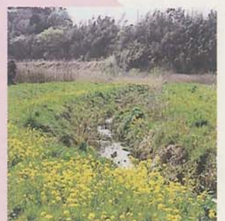
コンクリートから自然を生かした堤防へ(二重川)

船橋市は平成5年に、全国で初めて国からエコシティ(環境共生都市)に指定されました。エコシティとは、環境にできるだけ影響を与えないで暮らせるまちづくりのことです。市ではこの取り組みのほかにも、次のようなことをしています。