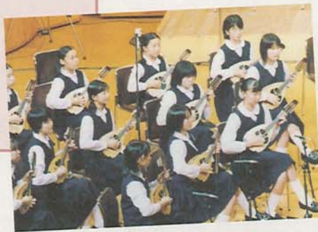
前原中ギターマンドリン部