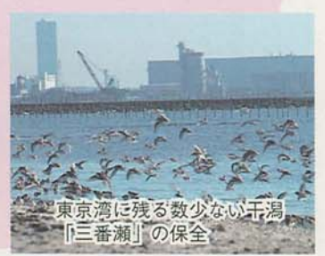
東京湾に残る数少ない干潟「三番瀬」の保全