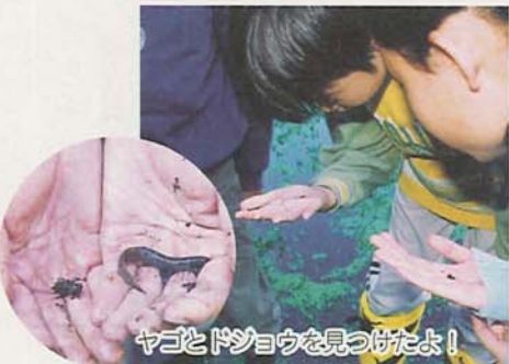
ヤゴとドジョウを見つけたよ!

子ども記者「水をきれいにしている、生きものがすめる場所にもなって、一石二鳥だね」市「今まで私たち人間は、開発などで生きものが暮らせる場所を減らしてきましたが、今船橋市ではエコシティをめざして、生きものがすめる所を増やす取り組みをしています」