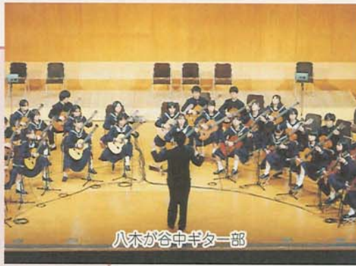
八木が谷中ギター一部

また、ともに関東代表として出場した前原中ギターマンドリン部も努力賞を受賞しました。