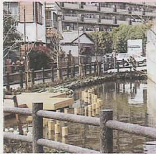
市民と一緒に、わき水を復元(東中山のゲエロの池)