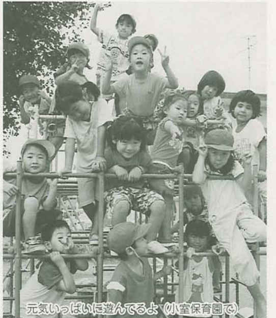
元気いっぱい遊んでるよ(小室保育園で)

市内には45か所の保育園(公立27、私立18)があり、家庭でお子さんの世話ができない保護者に代わって保育をしています(左表)。 10月1日(月)から14年度の保育園入園の申込みを、市役所保育課または入園を希望する保育園で受け付けます。先着順ではありませんので、14年1月末までに申し込みください。