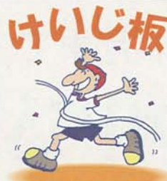
金額のないものは無料

【選評】一首目。岩ツバメの東は滝の後ろにあるのだから。炎暑に見たそのさわやかさを歌っている。二首目。「唐突に向き変へ」に老人の心がよく出ている。いかめしい不動尊の名も良い。三首目。絵手紙を、今の平安のしるしと受けとる友愛の心があたたかい。四首目。「古柵」はややムリな言い方だが、第二句以下、しみじみとさせる。五首目。マネキン人形であろうが、男性のそれだろうか。「君」にやや迷う。六首目。「小石川後楽園にて」と注記にあった。いろいろと出歩いて歌を作るのも良いことです。