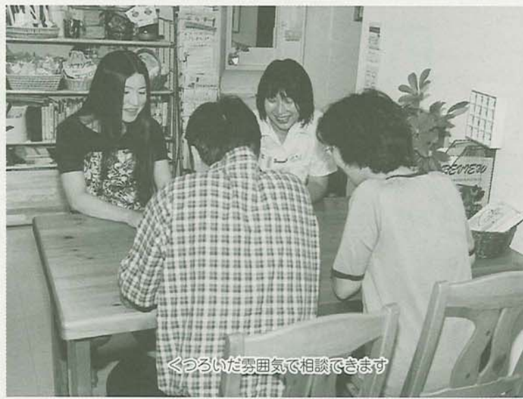
くつろいだ雰囲気でも相談できます