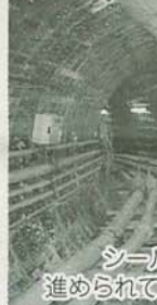
シールド工法で工事が進められている谷津幹線の管さき

下水道処理が始まったら、下水道の計画、建設、受益者負担金、トイレの改造費の貸付制度など、なんでもご相談ください。