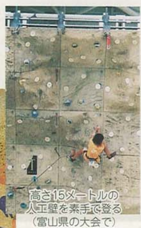
高さ15メートルの人工壁を素手で登る(富山県の大会で)