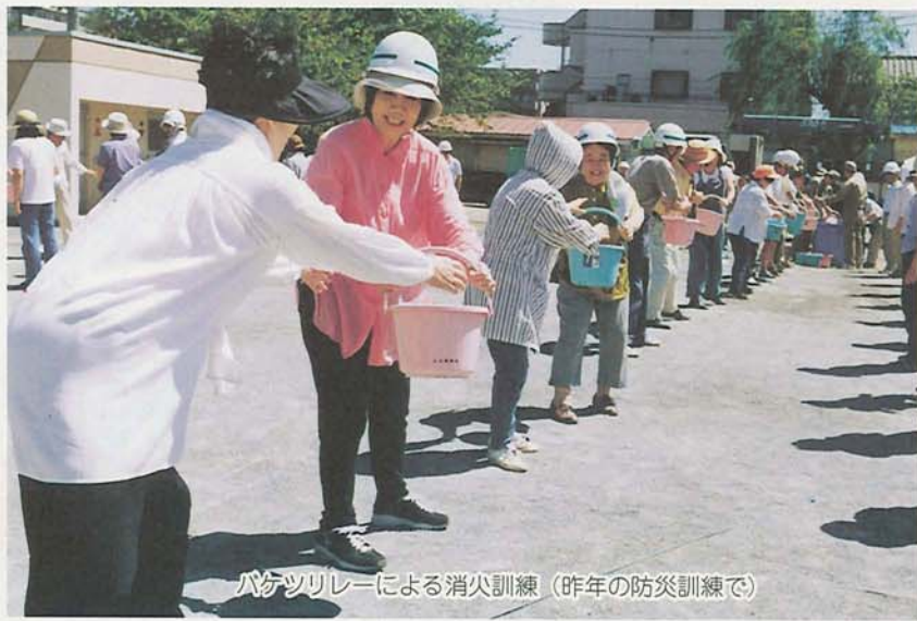
バケツリレーによる消火訓練(昨年の防災訓練で)

阪神・淡路大震災から6年余りが過ぎ、皆さんの災害に対する心構えは大丈夫ですか。市では「防災週間」にあわせて毎年総合防災訓練を実施しています。今年も9月2日(日)に全市民参加型の避難を主な目的とした訓練を行います。ぜひ参加を!