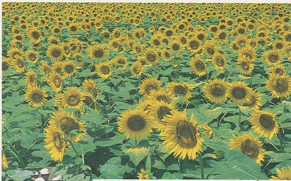
◀ひまわり畑の迷路を探検