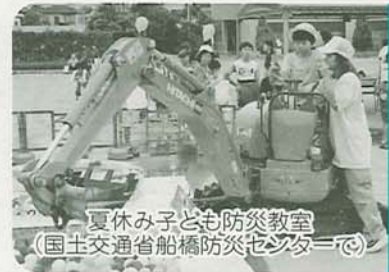
夏休み子ども防災教室(国土交通省船橋防災センター)