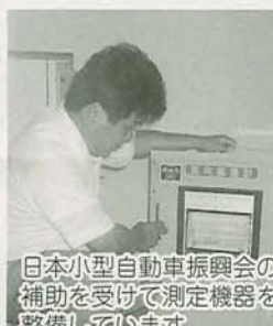
日本小型自動車振興会の補助を受けて測定機器を整備しています