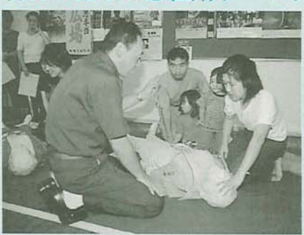
呼吸や心臓が止まった人の命を救う「心肺蘇生法」も体験できます

救急医療で命が助かって、リハビリをしないと、歩けなくなったり麻痺などの障害が残ることがあります。リハビリは、治療中にリハビリを行うことが出来ます。今回は、急性期リハビリについて考えます。