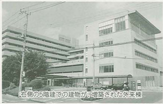
右側の5階建ての建物が、増築された外来棟

外来患者の増加に対応するため、昨年8月から外来棟の増築を進めてきました。外来診察室の待合場所が、広く快適になりました。