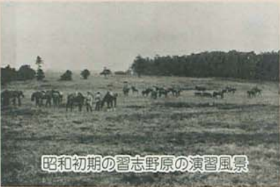
昭和初期の習志野原の演習風景

後に習志野原演習場と呼ばれました。坪井から北習志野方面に入る谷津には射撃場が造られ、後につと南側に移されてからは「古射弾」と呼ばれていました。また、その上流には「子は清水」という泉があり、軍馬の水飲み場として利用されてきました。 当時の習志野原演習場では、実弾による射撃演習が行われていました。訓練の開始と終了は花火で知らせ、演習場内の道路は時間内は