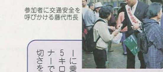
参加者に交通安全を呼びかける藤代市長