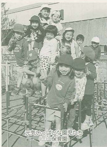
元気いっぱいな園児たち(三山保育園)

※年齢は4月1日現在による ○C階層：前年度分の市民税のうち所得割課税世帯 ○D階層：前年度分の所得税課税世帯