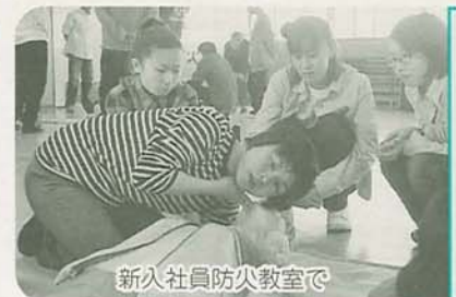
新入社員防火教室で

必要)で、団体行動ができ、事前説明会に参加できる人定員8人(多数は選考)費用4万5000円(中・高・大学生は無料)申込み5月25日(金)(必着)までに、所定の応募用紙に必要事項を書いて直接または郵送で企画調整課(〒273-8501)※住所不要 ☎436・2053へ※用紙は同課、各出張所・公民館で配布 医療センター パート看護師(士) □対象看護婦(士)免許のある40歳くらいまでの人 問合せ同センター総務課 ☎438・3321 国税専門官 □受験資格昭和49年4月2日～55年4月1日生まれの人、または55年4月2日以降に生まれ、大学を卒業し(未成年者は保護者の同意がたか、14年3月までに卒業 見込みの人※人事院が大学卒業と同等の資格があると認める人も可 受付期間5月10日(木)(必着) 試験日6月17日(日)(一次) 問合せ船橋税務署総務課 ☎422・6511内線211 大穴ふるさと農園入園者 □期間6月1日～14年4月30日 場所大穴北2～24区画数145区画(二世帯1区画。多数は抽せん) 費用年4800円(16㎡) 申込み5月14日(日)(必着)までに往復ハガキに住所、氏名、電話番号、「大穴ふるさと農園希望」と書いて農産課(〒273-8501)※住所不要 ☎436・2490へ※駐車場がないため、徒歩・自転車での利用となります 房総フロンティア アドベンチャー参加者 青少年がグループに分かれて酒々井町をスタート。地域の人々とふれあひ、様々な体験をしながら栄町のゴールをめざします。この間、宿泊場所は民家の軒先など、自分たちでがします。 □日程8月1日(水)～8日(水) (7泊8日) 対象小学5年 高校生 募集人数42人(多数は抽せん) 費用1万円 申込み5月31日(木)までに県社会教育課 ☎43・223・4070へ