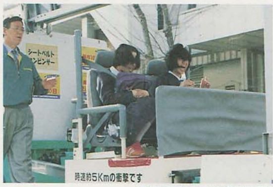
衝突体験で、衝撃の強さに驚く皆さん