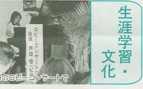
先月のロビーコンサートで

日時 5月13日(日)午前10時~午後2時 会場 運動公園※雨天は体育館で実施 内容 各種ゲームコーナー(ストラックアウト、チャレンジ100m、ティーボール、紙飛行機、竹とんぼを飛ばそうほか)、チャリディング、法田中マーチングバンド、はしご車、けむり体験コーナー、風速30mに挑戦、模擬店ほか ※当日参加賞有り 問合せ 青少年課 ☎436-2903 ※車での来場はご遠慮ください