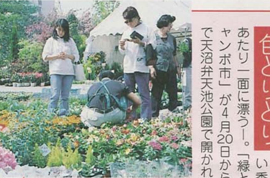
色とりどりの草花の甘い香りが、あたりに漂う。「緑と花のジャンボ市」が4月20日から22日まで天沼弁天池公園で開かれました。

交通事故防止 とマナー向上を目指して、4月8日、春の交通安全運動フェスティバルが行われました。会場の北習志野駅前歩行者天国では、子どもたちが白バイやパトカーに乗って大喜び。また時速5キロの衝突を体験するコーナーでは、シートベルトの大切さを実感していました。