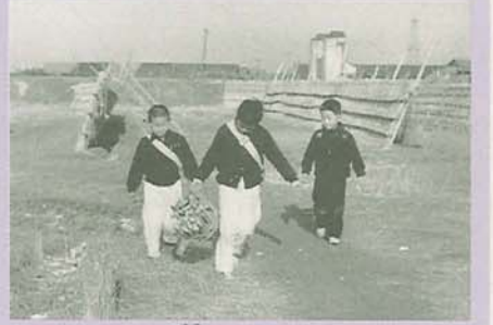
ストーブ用の薪を持って船橋小学校に向かう子どもたち。後方は都疎浜住宅 (昭和30年撮影)