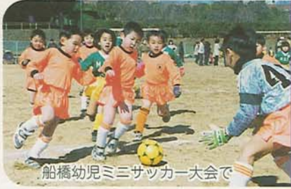
船橋幼児ミニサッカー大会で