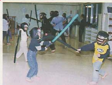
「パン、パン」と激しい音が室内に響きわたります。でも痛くはありません。

▲女子バレーボール 毎週(日)午後2時〜5時/中野木小学校/会費月500円/吉原 467・7568(夜) ▲クラシックバレエ 毎週(木)午前11時〜午後0時15分 船橋アリーナ 入会金1500円/会費月3000円