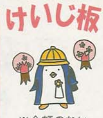
※金額のないものは無料

「選評」一首目。「一ヶ所」がどこか不明確だが、下句は落葉の踊りを思わす句の斡旋が巧み。二首目。心打たれる内容。作者六十一、二歳か、現世の複雑さ、そこにひそむ悲哀などに読む心が及ぶ。三首目。「雪」が一首の中で生彩を持つ。老夫婦の楽しみの日であろう。四首目。「ともがら」は「仲間」のこと。さつき愚痴を言っていた友が、いま一心に唱っている。長唄か、民謡か。グチも世の中に必要だ。五首目。襲名披露の舞台らしい。作者が習われたのは三味線の曲のほうか。六首目。どこか分からぬが、手袋は人の手の感じがあつて、とかく目を惹く。