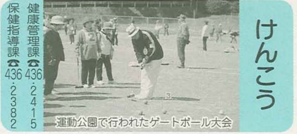
運動公園で行われたゲートボール大会