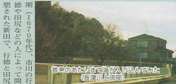
昔このあたりまで海が入り込んでいた (長津川上流部)

長津川の上流の低地を取り巻く塚田の台地があります。そこに初めて人が住んだのは、縄文時代の中頃から後期(約4千年から3千年前)と言われています。当時、この台地あたりまで海が入り込み、奥深い入江になっていました。縄文時代の人々が食べた貝の捨て場だった貝塚が台地の広