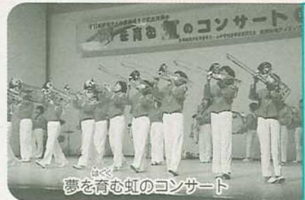
夢を育む虹のコンサート