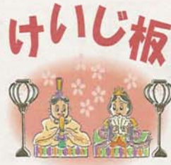
※金額のないものは無料

・ハガキ1枚に3作品まで。ハガキは一人2枚まで。常用漢字以外の読み方をする語句については、ふりがなをお願いします