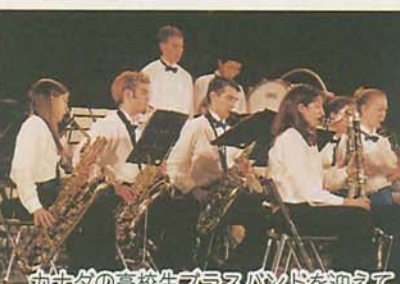
カナダの高校生ブラスバンドを迎えて

千人の音楽祭 が2月11日に行われ、音楽を愛する1700人を超える市民や小中学生が出演。交響曲やポップス、邦楽、ジャズなどを熱演しました。フィナーレでは出演者全員がフロア一杯に広がり、「LOVEマシーン」を熱唱。会場の船橋アリーナは興奮と感動に包まれていました。