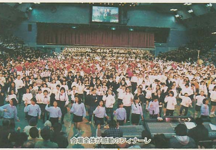
会場全体が感動のフィナーレ