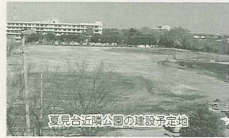
夏見台近隣公園の建設予定地

アンデルセン公園を拡張するため、国からの補助を受けその用地を購入します。このほかにも(仮称)前原東2丁目公園等5か所の公園用地を取得。夏見台近隣公園等3か所を整備します。