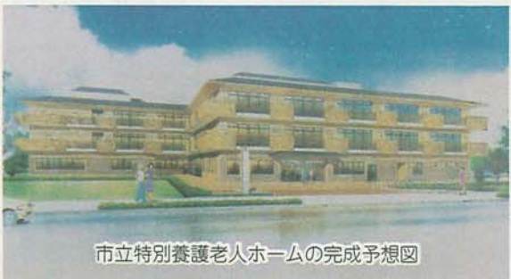
市立特別養護老人ホームの完成予想図

地方自治法が改正された場合、本市は中核市への道が開かれます。保健所など市民にとって身近な業務が市で実施され、サービスの一層の充実につながるようになります。15年4月の移行を目指して庁内に中核市移行および保健所設置のための組織を新たに設けます。