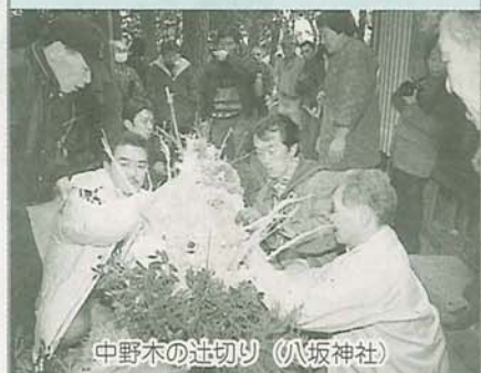
中野木の辻切り (八坂神社)