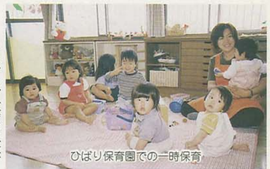
ひばり保育園での一時保育

4月から、重度の障害を持つ児童を保育園で預かりします。集団の中で保育することで社会性が培われ、成長がより促されると判断できる児童が対象となります。