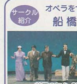
前回の舞台「蝶々夫人」より

歌が好きでも、ただ歌うだけでは物足りない... そんな方にお勧めしたいのがオペラです。