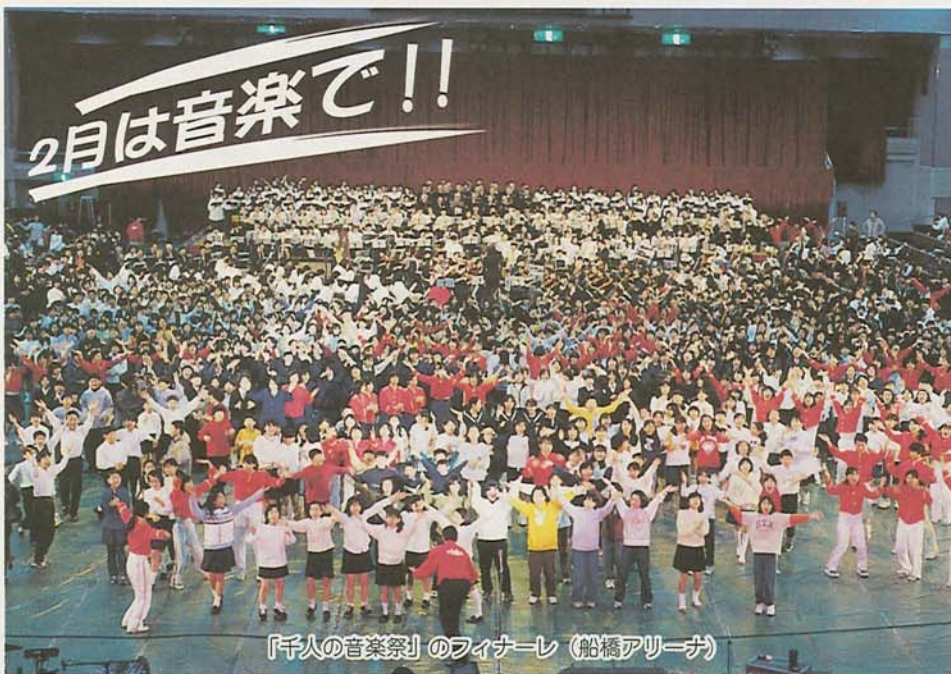
「千人の音楽祭」のフィナーレ(船橋アリーナ)