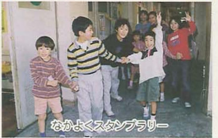
なかよくスタンブラリー

習志野台第二小では、兄弟学級といつて1年生は6年生と、2年生は4年生と、3年生は5年生と一緒に遊んだりして交流を深めます。その週をふれあい週間といひます。