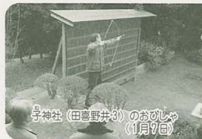
子神社(田喜野井3)のおひしや(1月7日)