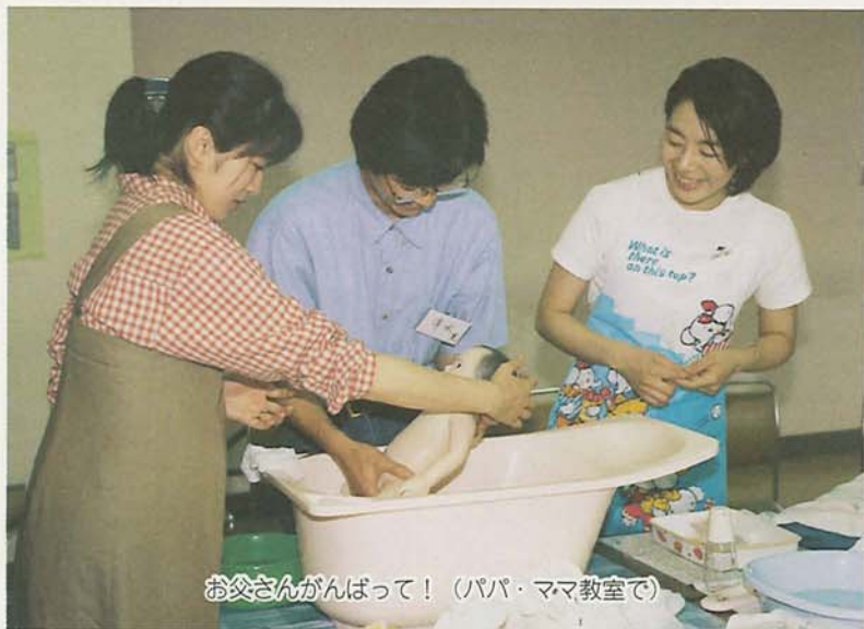
お父さんがんばって! (パパ・ママ教室で)

これらを受けて市でも、新しいプランの策定を11年度から進めています。 計画づくりは市民の皆さんとともに 。計画は、13年度から23年度までの市の施策の指針となるものです。骨子案には、