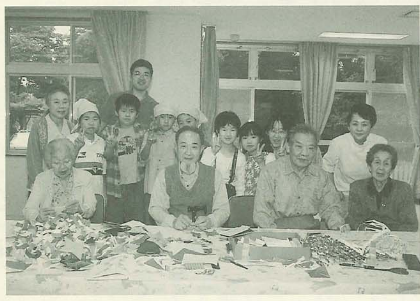
三山老人デイサービスセンターには子どもたちの元気な声が聞こえてきます

4月にオープンしたこの施設は、高齢者をねたきりにさせないという福祉先進国デンマークの姉妹都市・オーデンセ市のシステムを取り入れました。リハビリセンター、ケアハウス、在宅介護支援センターからなる複合施設で、高齢者福祉の新たな拠点となります。(4月1日号)