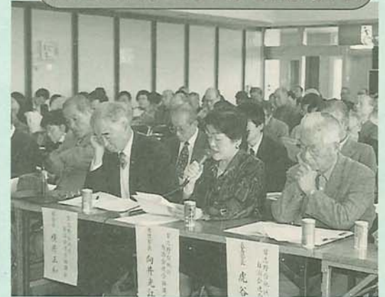
会場に入りきれないほどのたくさんの人が参加。市政について活発に意見が交わされました。

第8回市政懇談会が11月21日、習志野台公民館で開催されました。今回の懇談会には、地元自治会・町会などから約200人が参加しました。また、市側からは市長はじめ関係部長が出席。道路、下水道、福祉、教育、防災などの地域に関する諸問題について議論が交わされました。