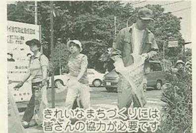
きれいなまちづくりにには皆さんの協力が必要です