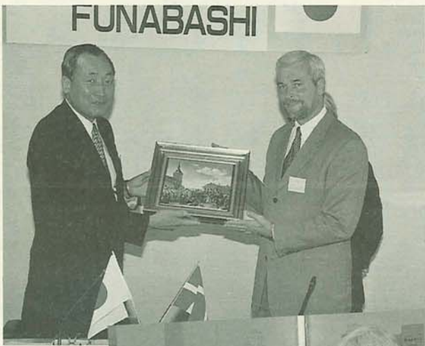
◀ボイ工市長から藤代市長に陶製画が手渡されました