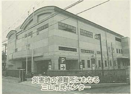
災害時の避難所にもなる三山市民センター