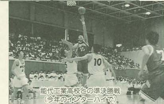
能代工業高校との準決勝戦(今年のインターハイで)

一方、女子は4区で区間賞をとるなど安定した走りであり、大会が始まって以来10年連続の優勝を飾りました。昭和61年に男子が、平成元年と4年には女子が全国優勝戦が行われます。