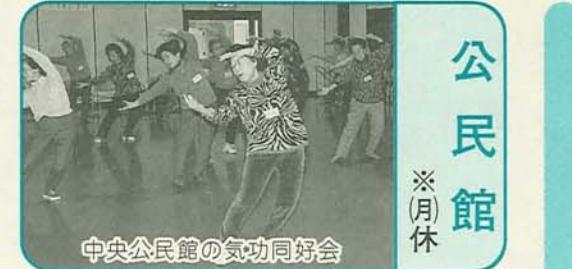
中央公民館の気功同好会 ※月休

マチャリテイクアウト 12月15日(火)17時～20時 28日(木)午後0時30分～4時30分