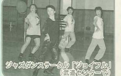
ジャズダンスサークル「ジョイフル」(武道センターで)