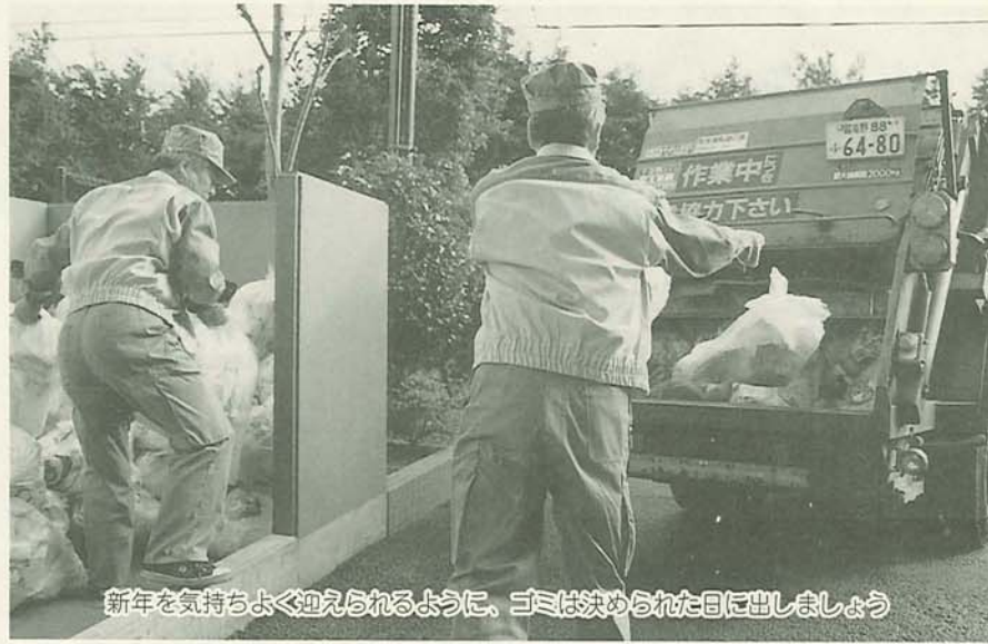
新年を気持ちよく迎えられるように、ゴミは決められた日に出しましょう