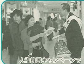
人権擁護キャンペーンで