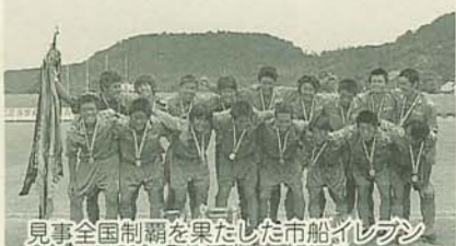
見事全国制覇を果たした市船イレブン