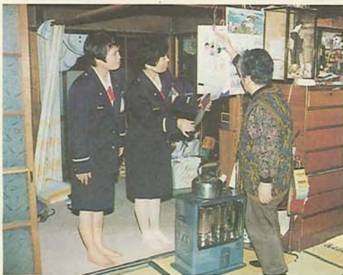
ストーブの上のカレンダーは危ないですよ (女性消防団員による防火指導)