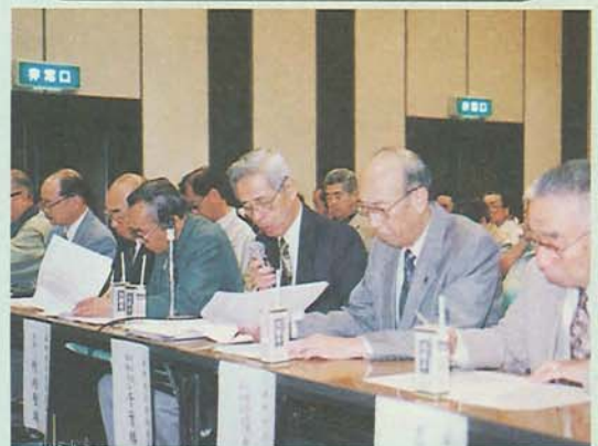
地域に密着した問題を直接市長と話せる懇談会。皆さんの率直なご意見をお聞かせください

第7回市政懇談会が10月17日、中央公民館で開かれました。 対象は、海神地区で、町会・自治会などの皆さん116人が参加。市側から市長をはじめ、関係部課長14人が出席しました。 最初に市長から海神地区の今後の市の計画について説明があり、引き続き交通、道路、教育など地域の諸問題22項目について意見が交わされました。主な内容は次のとおりです。 〈京成本線連続立体化工事について〉 ― 工事が遅れていると聞いている。今後の見通しはどうか。進捗状況や見通しを広報紙で公表してほしい。 市 海神駅から船橋競馬場駅間の立体化工事は、県が主体となって来春の完成を目指して進めている。現在、95パーセントの用地を取得、残りの部分は、補償金額の考え方の相違や代替地などの問題で大変厳しい状況にあり、数年遅れると聞いている。今後も県、京成電鉄と連携を強め、早期