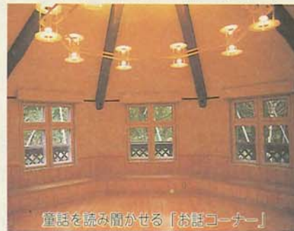
童話を読み聞かせる「お話コーナー」

で、総工費は約3億8400万円。世界的な童話作家、ハンス・クリスチャン・アンデルセンの生まれ故郷で、船橋市と姉妹都市提携をしているデンマーク・オーデンセ市の街と自然を映像やパネルで紹介する「ギャラリー・オーデンセ」、アンデルセンの住んでいたアパートの部屋を再現し、童話と人をパネルやショーケースで紹介する「ギャラリー・アンデルセン」、アンデルセン童話のアニメ映像、紙芝居ショーケースで紹介する「シアター」などを行う「ギャラリー・アンデルセン」があります。