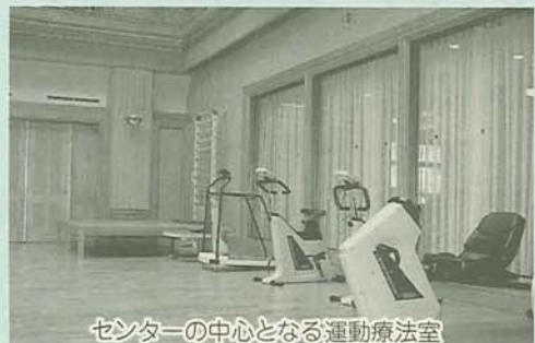
センターの中心となる運動療法室