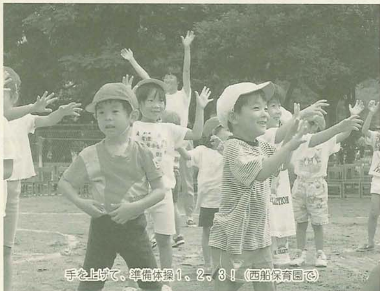
手を上げて、準備体操1、2、3!(西船保育園で)

★印は私立保育園です。保育時間については、時間外保育を含みます。産休明けは、生後57日目以降(原則翌月1日入所)が可能です。緑色は、障害児保育(3歳以上)有り。