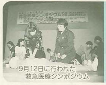
9月12日に行われた救急医療シンポジウム