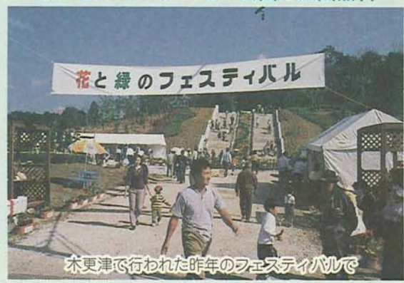
木更津で行われた昨年のフェスティバルで