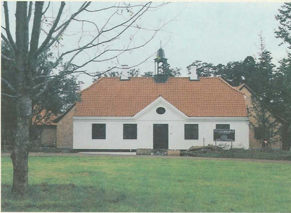
1800年代のデンマークにタイムスリップ? メルヘンの世界を今に伝える童話館