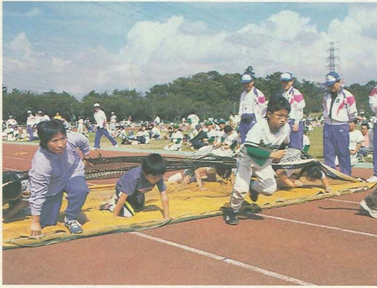
毎年、子どもから大人まで多くの参加者が集うスポーツ健康の祭典(運動公園陸上競技場)