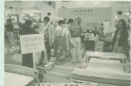
昨年の介護機器フェア