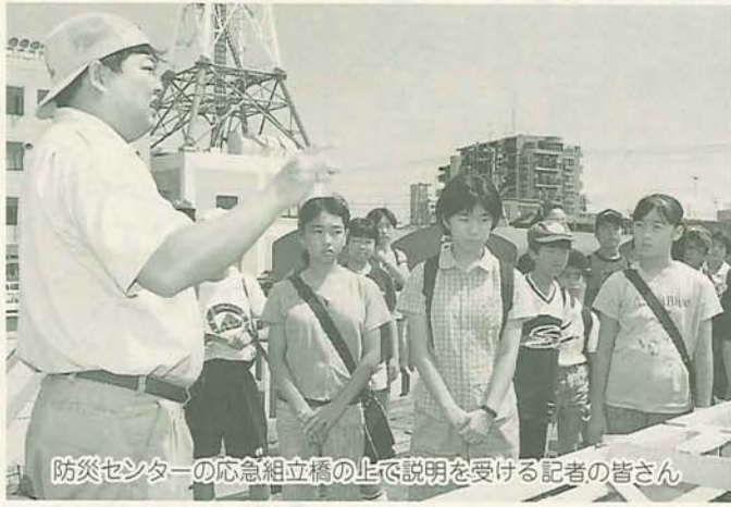
防災センターの応急組立橋の仕組み説明を受ける記者の皆さん