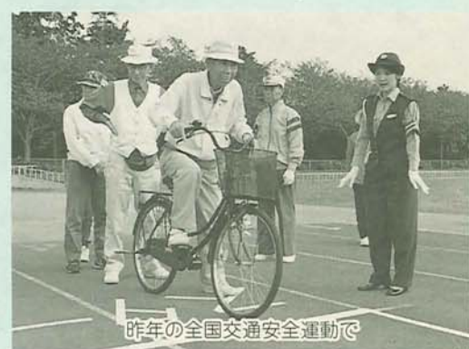
昨年の全国交通安全運動で

交通安全運動は市民の皆さんに交通安全の知識を広め、交通事故の防止を図ろうとするものです。 9月1日現在における、県内の交通事故死者数は257人。昨年比で55人減っていますが、全国ではワースト3位となっています。 交通ルールをきちんと守り、正しい交通マナーを心がけましょう。 (スローガン) 反射材 光る あなたの心がけ、 あなたを守ります (重点目標) ○高齢者の交通事故防止 ○シートベルトの着用の徹底 ○夜間事故の防止 ○自転車の通行マナーの向上 ○自転車の通行指導 ○自転車の安全通行街頭指導など 期間中は様々な交通安全に関する行事を実施します。 ○船橋警察署管内(22日)火 午後3時～ 市内の5高校の生徒を対象に自転車通学の街頭指導など ○船橋東警察署管内(28日)午後4時～ 三山商店街で自転車の安全通行街頭指導など 高齢者の事故防止のためのシルバリーライダーを委嘱 市では、近年急増している高齢者の交通事故を防止するために、25日(金)に老人クラブなどの交通安全担当者278人をシルバリーライダー(高齢者交通安全指導員)として委嘱します。 今後、老人クラブなどで指導・研修を行っていただきます。 普段からの心がまえがあなたを守ります 運転をする際や歩行時には、次のことに注意してください。 ○病氣・疲労の時には運転をしない ○運転中は、たとえエアバックがあってもシートベルトを必ず着ける ○夜間に歩行するときは明るい色の衣服を着用する ○自転車には反射材を取り付ける 問合せ 船橋警察署 ☎ 35 0110 船橋東警察署 ☎ 67 0110 道路管理課 ☎ 36 2292