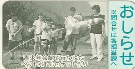
青少年会館で行われたネット作り