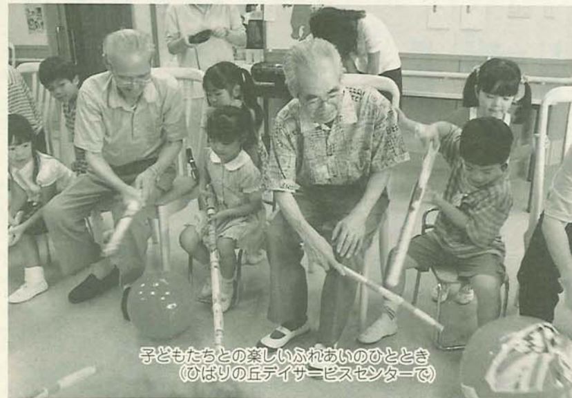
子どもたちの楽しいふれあいのひととき(ひばりの丘デイサービスセンターで)

平成10年4月1日現在、65歳以上の人は、市の人口全体の11・0パーセント。市では、高齢者の皆さんが生きがいをもって暮らし、病気になるたときでも安心して過ごせるようなまちづくりを目指しています。今回は、市の各種サービスについてお知らせします。