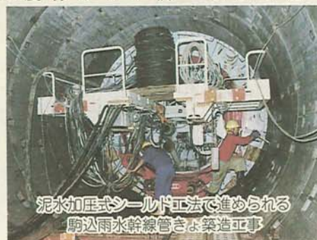
泥水加圧式シールド工法で進められる駒込雨水幹線管きよ築造工事

印旛処理区では、船橋東郵便局付近から船橋アリーナに向う全長600メートル、内径3・25メートルの駒込雨水幹線管きよ築造工事が昨年度から始まっています。12