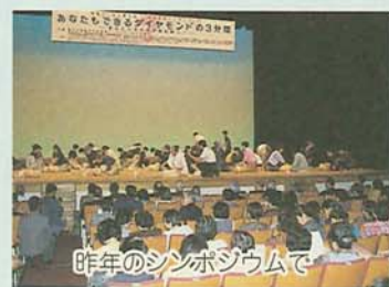
昨年のシンポジウムで

そばにいる家族や友人が急に呼吸停止や心停止に陥った時、どのように対処したらよいでしょうか。