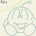
ドット21号 (Dr.クリーンの助手)

皆さんに、下水道に関する理解を深めてもらうため、各種行事を行います。気軽に参加してくださいね。