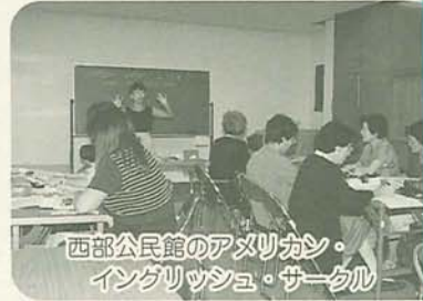
西部公民館のアメリカ・イングリッシュ・サークル

富町4へ ▽硬式テニス教室(初・中級) 日程・会場・申込み前掲ゴルフ教室と同じ/午後3時〜4時30分/講師日本プロテニス協会認定コーチ/30人※多数は抽せん/費用5000円