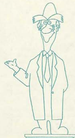
Dr.クリーン (下水道キャラクター)

私たちが快適に暮らすうえで欠かせない下水道。船橋市の下水道普及率は、9年度末で37.4パーセントとなっています。市では今年度も256億円を超える予算を投入し、普及率の向上に力を注いでいます。今回は9月10日の全国下水道促進デーにちなんで、市の下水道の整備状況についてお知らせします。