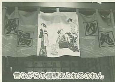
昔ながらの情緒あふれるのれん

す。民生委員を通じた手続きが必要で、問い合わせは高齢者福祉課(36)2352へ。 ▼「香り湯」は毎月26日市内の銭湯では、入浴しながら香りを楽しんでもらおうと、毎月特定の日(主に26日)に、レモンや花梨などの「香り湯」を実施しています。(左表を参照)