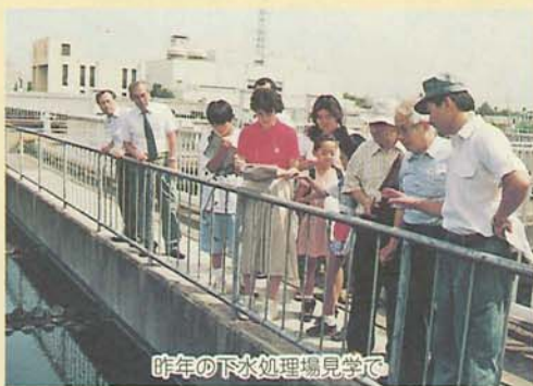
昨年の下水処理場見学で

「家から出たごみや水はどこへ行くのかな」「地震が来たらどうすればいいのかな」など、くらしの中の気になることを現場に行き考えてみませんか。