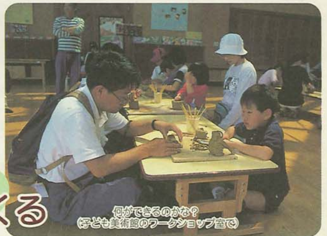
何ができるのかな？ (子ども美術館のワークショップ室で)

待ちに待った夏休みが始まりました。海、山、プールなど、夏は楽しいことがいっぱいあります。でも、なかには「宿題の自由研究が気になって…」、「いい題材が見つからない…」なんて困っている人はいませんか。そこで今回は、皆さんに役立つような情報をとんと集めてみました。