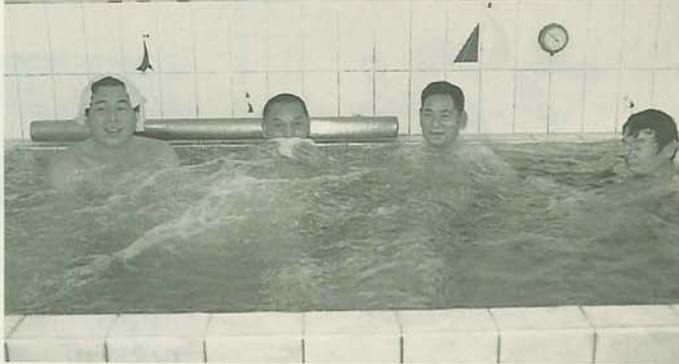
広々とした湯船には、家族風呂では味わうことのできない開放感があります