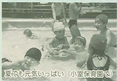
夏でも元気いっぱい(小室保育園)