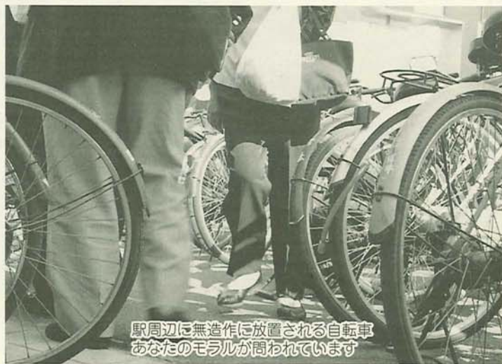
駅周辺に無造作に放置される自転車 あなたのモラルが問われています

空きのできた市の駐輪場(自転車等駐車場)の利用者を募集します。月ぎめで利用しようとする人は、忘れずに手続きをしてください。 〔募集する駐輪場〕 左表のとおり 〔利用できる人〕 住居や勤務先などが、駅からおおむね800メートルを超える通勤・通学者等で、現在他の駐輪場を利用していない人 〔利用できる期間〕 7月1日～11年3月31日 〔整理料金〕 下表のとおり(消費税相当額が加算されます)。市外の方はそれぞれの2倍の金額です。