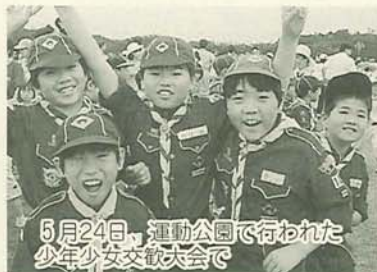
6月24日、運動公園で行われた少年少女文芸大会で

が風雨で流出するなど、歩行者の通行を妨げる状況が生じています。自己所有地や樹木の適正な管理をお願いします。