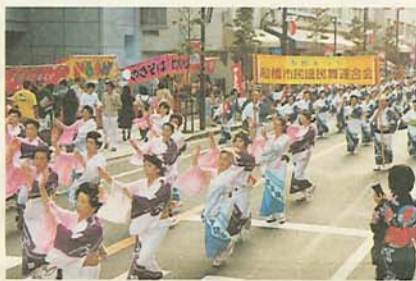
毎年大勢の人が踊りを披露します (市民まつり・民謡パレード)

□日時 7月24日(金)～26日(日) 午前10時～午後6時 会場 市民ギャラリー(スクエア21ビル3階) 内容 パネル、製品、模型、サンプル等の展示、異業種交流、リサイクル事業の