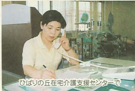
ひばりの丘在宅介護支援センターで