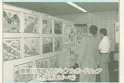
真間川流域のビジュアルボードフェア(市役所ロビー)