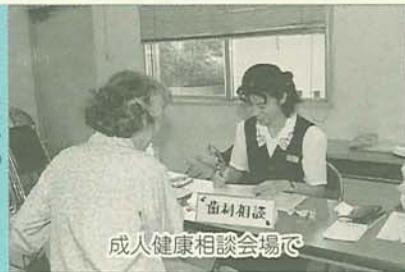
成人健康相談会場

健康管理課 ☎2415 保健指導課 ☎2382 (〒273-8501 湊町2-10-25)