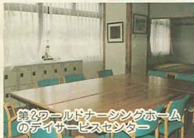
第2ワールドナーシングホームのデイサービスセンター