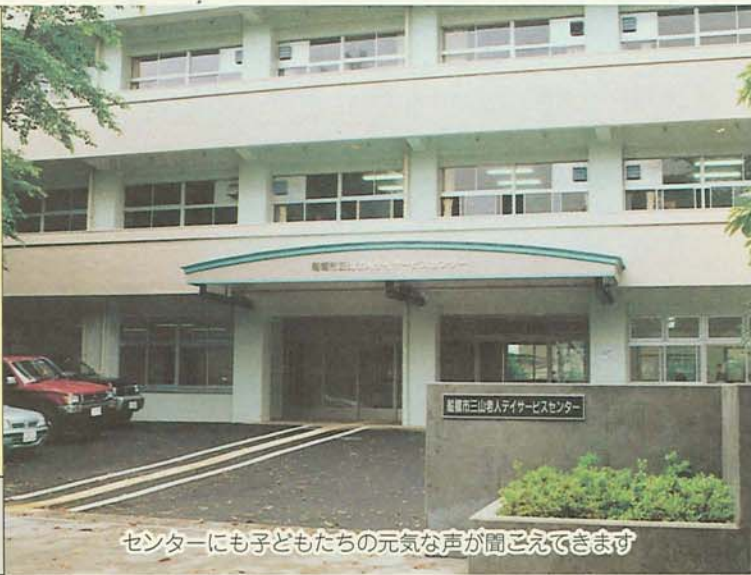
センターにも子どもたちの元気な声が聞こえてきます