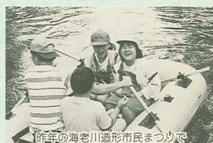
昨年の海老川造形市民まつりで