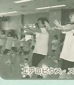
エアロビクス・スクールで

船橋百寿苑在宅介護支援センター (特別養護老人ホーム船橋あさひ苑内) ☎7722 (旭町4)