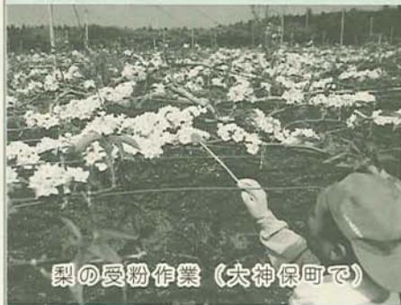
梨の受粉作業(大神保町で)