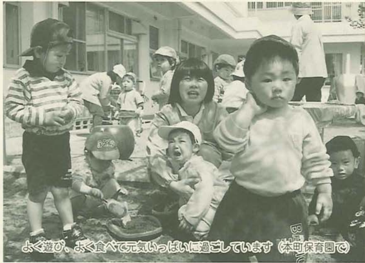
よく遊び、よく食べて元気いっぱい過ごしています(本町保育園で)

現在、市内には45の保育園(市立27・私立18)があります。社会の変化に因應するため「利用しやすい保育園」をめざし、児童の福祉向上に努めています。