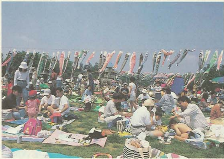
たくさんのこいのぼりと一緒にお弁当(アンデルセン公園)