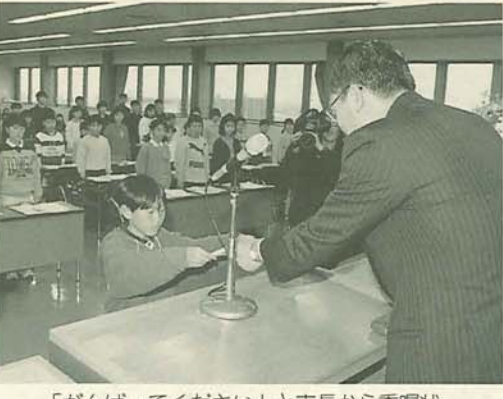
「がんばってください」と市長から褒状が手渡されました