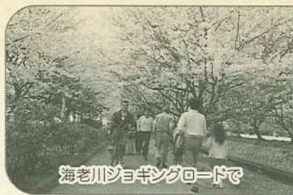
海老川ジョギングロードで