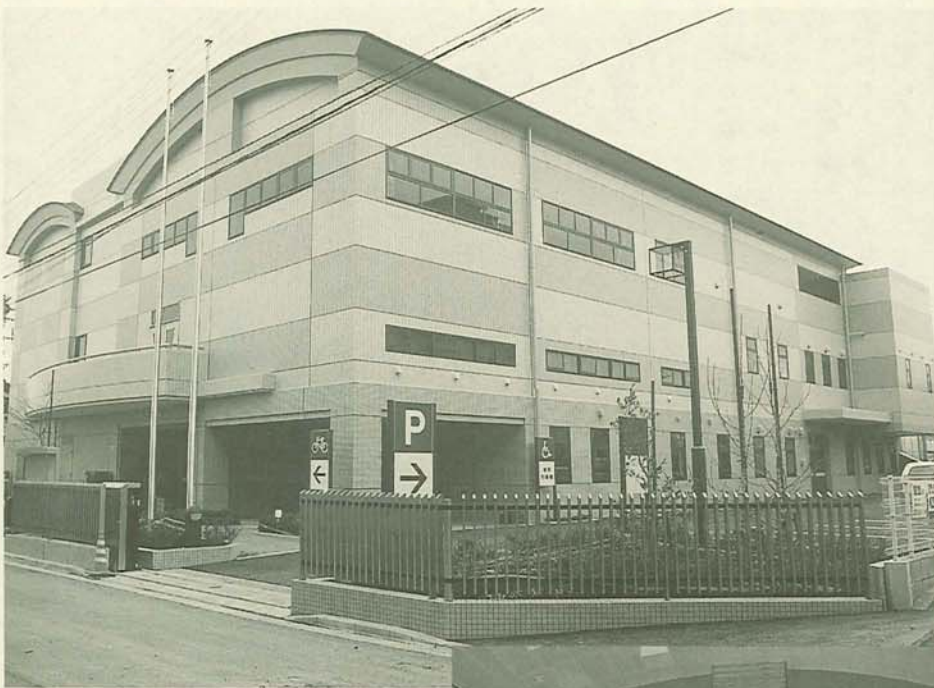
さわやかな外観の三山市民センター