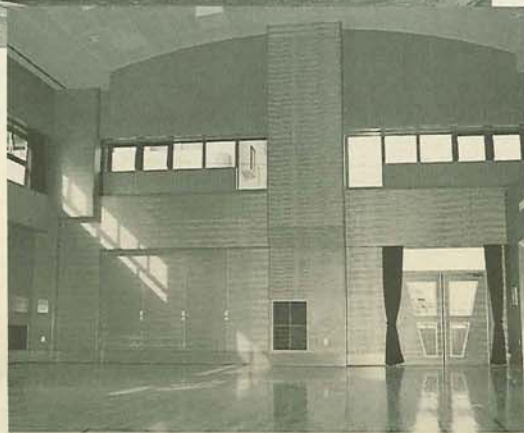
▲軽スポーツなどにも利用できる多目的ホール

薄茶色の外壁で落ち着いた外観の建物は、鉄筋コンクリート3階建て、延べ床面積は約1690平方メートル。事業費は約7億円です。1階にはコミュニティルームや展示ギャラリー、自由に閲覧できる図書コーナー、料理サークルなどで利用できる調理室、また、市役所連絡所も入ります。2階にはコンサートや講演会などに利用できる多目的ホールをはじめ、会議室、音楽室、軽運動コーナーでは気分転換に汗を流すこともできます。屋上には人工芝を敷いた広場があり、子どもからお年寄りまで楽しめる施設となっています。同センターは、町会・自治会や各種サークルなどの活動