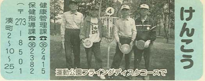
健康管理課 ☎2415 保健指導課 ☎2382 (〒273-8501 湊町2-10-25)

一般の歯科診療所で治療が困難な、市内在住の心身障害児(者) 在宅で介護を必要とする高齢者で、在宅医療・介護支援センターに登録している人 〈診療方法〉 マ心身障害児(者) ①電話で申込み ②診療所で受診 ▼介護の必要な高齢者 ①電話で申込み ②歯科医が家庭を訪問し、歯や身体の状態をあらかじめ診察(予診) ③予診の結果、移動が困難な人は自宅での診療(訪問診療、移動できる人は診療所で受診 ※状況に より寝台車の手配や専門病院の紹介も行います 〈診療日・診療時間〉 マ心身障害児(者) 毎週(木)、毎月第2(土)、(出)が5回ある月の第4(土)午前9時30分～午後0時30分 ▼介護の必要な高齢者 毎週(日)、心身障害児(者)の診療のない(土)午前9時30分～午後0時30分 〈受付時間〉 午前9時～午後3時※毎週(火)を除く ◆健康保険証は必ずご持参ください さざんか歯科診療所 ☎497557