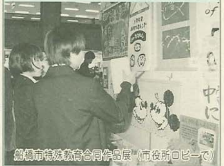
船橋市特殊教育合同作品展(市役所ロビーで)