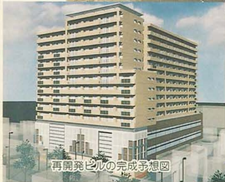
再開発ビルの完成予想図

地域の活性化 を目指して。2月13日、本町4丁目地区市街地再開発ビルの起工式が行われました。このビルは平成12年2月に完成予定。地上14階、地下2階建てで、スーパーや住宅などが入るほか、中央図書館も移転します。