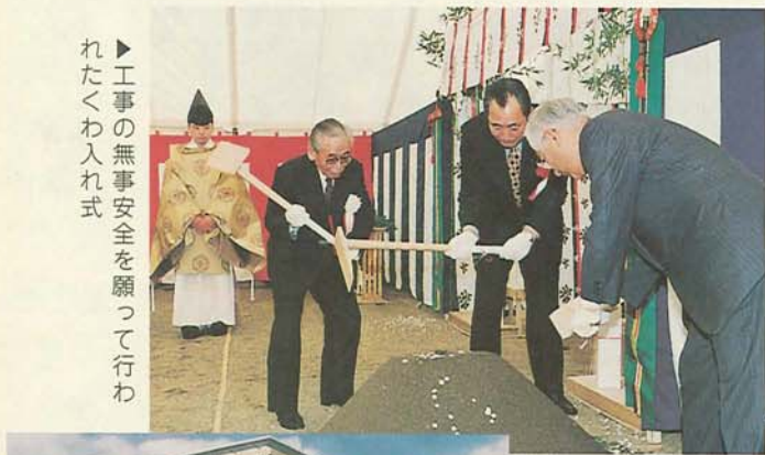
工場の無事安全を願って行われたくわ入れ式