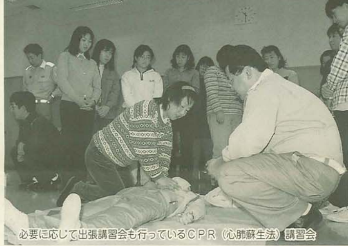
必要に応じて出張講習会も行っているCPR(心肺蘇生法)講習会