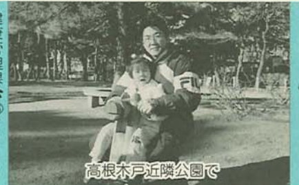
高根本戸近隣公園で

健康管理課 ☎2415 保健指導課 ☎2382 (〒273-8501 湊町2-10-25)