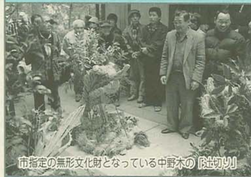
市指定の無形文化財となっている中野木の「切切」