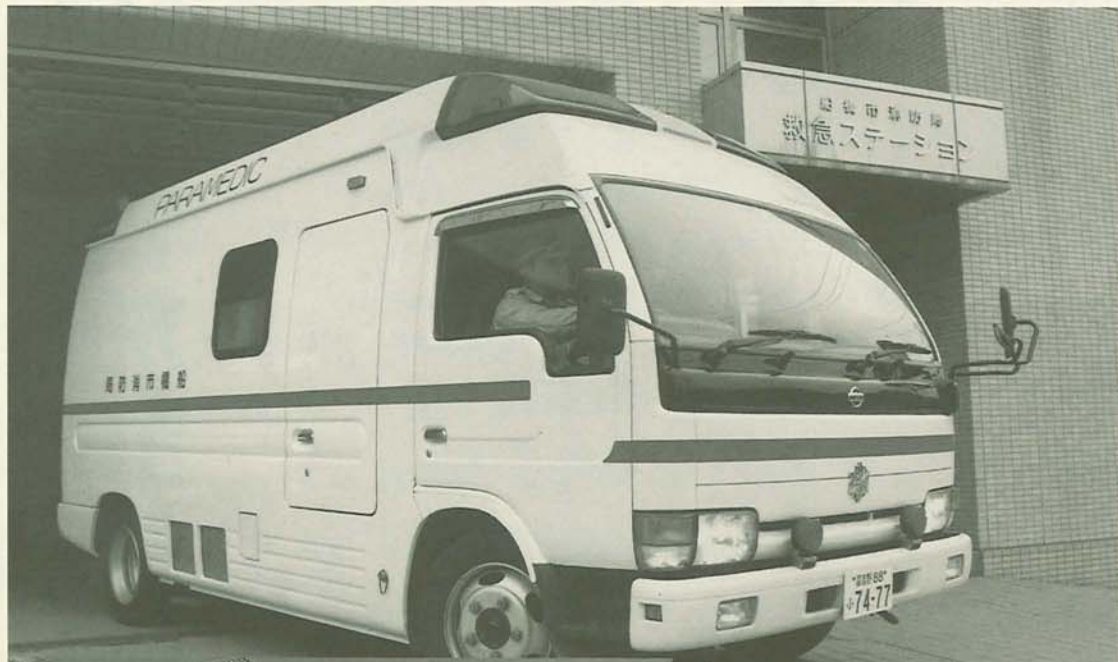
▲かけがえない命を守るため、出動するドクターカー

一般の救急車は患者を病院に運ぶまでに20分以上かかりますが、ドクターカーでは、患者が医師の処置を受けるまでの時間は約半分に短縮されました。患者が現場で医師から受ける薬剤の投与などは、病院へ行った際の医療行為と同様に、治療費や往診料などの診療費がかかります。