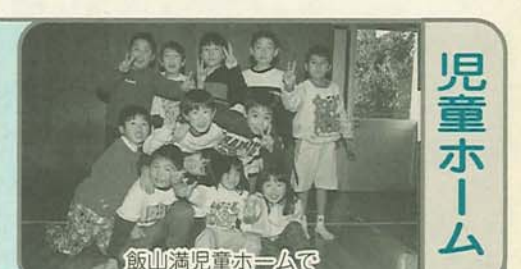
飯山満児童ホームで

松が丘 ☎5087 マこともまつり 2月28日(土)午後1時30分～3時30分 映画、ペーパークラフト、ゲーム/幼児(保護者同伴) 小学生先着120人/費用200円/費用を添えて申し込み 金杉台 ☎7837 マこともまつり 2月27日(金)午前10時30分～11時30分/保健婦による冬の病気の対処法、身体測定、仲間作りゲーム、手あそび、ダンス/0・1歳の幼児の親子先着15組/直接または電話で申し込み マ4・5歳児リトミックパトイ 2月20日(金)午後3時30分～4時30分/和音あそび、幼児テクニク、リズムゆらぎ他/4・5歳の幼児の親子先着10組/直接または電話で申し込み 小室 ☎1000 マこともまつり「見て作ってさわって」 2月28日(土)午前10時～手づくり教室(ドングリ)ほか/幼児(保護者同伴) 以上/整理券配布中 高根台 ☎63638 マ二輪車教室 2月21日、28日各(土)午後2時～午後4時/小学生先着20人/直接または電話で申し込み 新高根 ☎3940 マこともまつり 3月8日(日)午前10時～午後2時30分/映画会、ペーパークラフト、マジックショー、模擬店ほか/当日自由参加 海神 ☎4661 ママと遊ぼう 2月27日(金)午前11時～11時40分/おひなさま製作/2歳以上の教室に入っていない親子先着20組/費用50円/費用を添えて申し込み