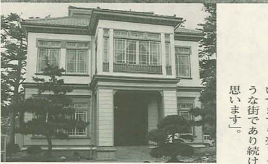
▲現在、「空挺館」として空挺団資料等の展示館となっている旧御馬見所は、当時、天皇家の宿泊所に利用されていました