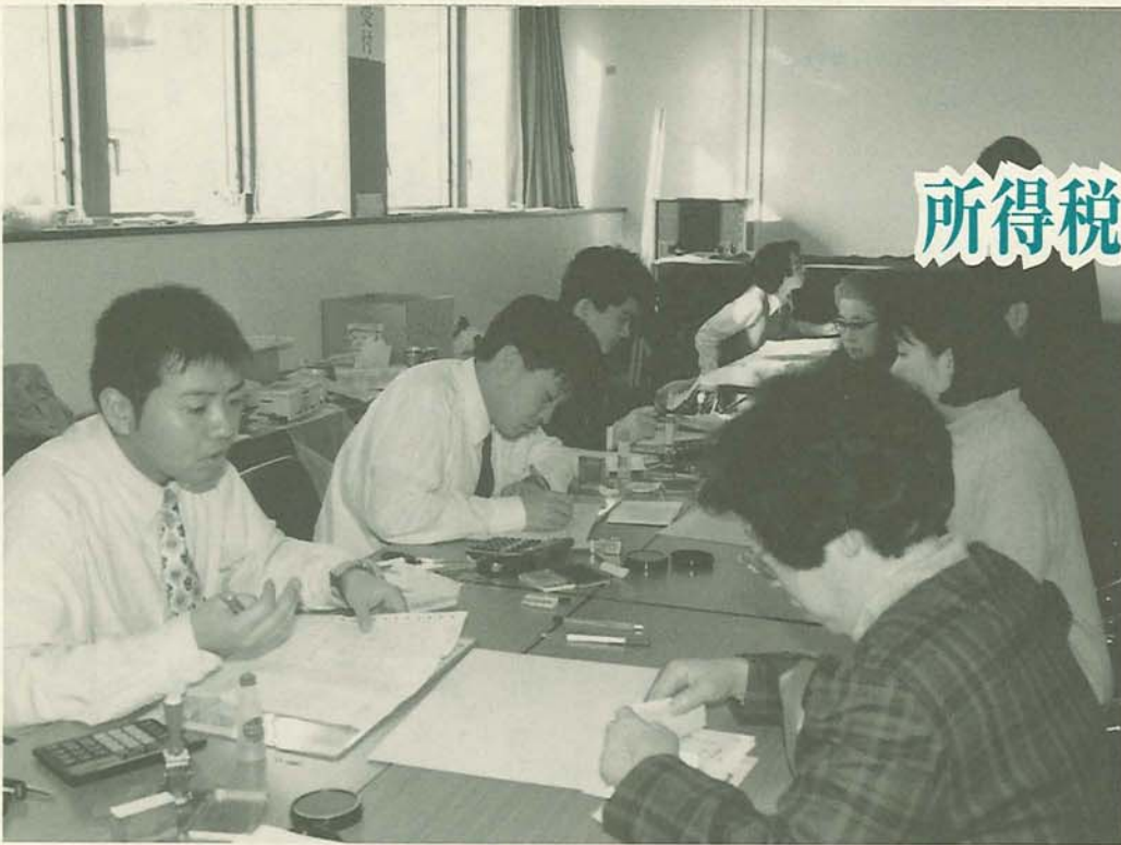
提出書類の確認を促されています。申告は早めに行いましょう。

所得税、市・県民税、国民健康保険料の申告が始まります。申告の受け付けと相談は2月16日(月)から3月16日(月)までです。なお、土曜日と日曜日は、税務署・市役所とも休みとなるため、申告の受け付けは行いませんので、ご注意ください。3月に入ると大変混み合いますので、早めに申告を済ませましょう。