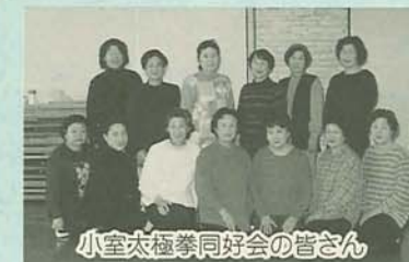
小室太極拳同好会の皆さん