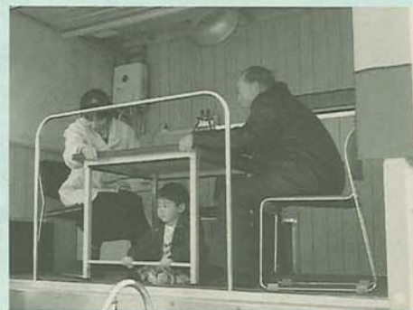
昨年の防災フェア(起震車体験コーナー)で

「見つめ直そう 身近な防災対策」をスローガンに、今年は、二和地区で防災フェアを行います。いざというときに備えて、ぜひご参加ください。