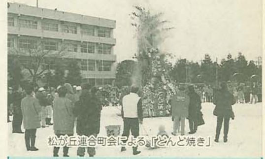
松が丘連合町会による「どんど焼き」