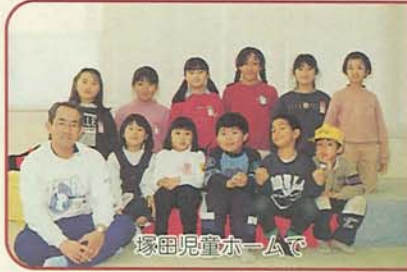
塚田児童ホームで