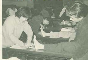
テーピングの指導を受ける学生の皆さん

大学では、自ら学ぶ体験学習をモットーに、「知っている」だけでなく、「知っている」の中で実際に「活動」できる「一員」になれるようなカリキュラムを用意しています。