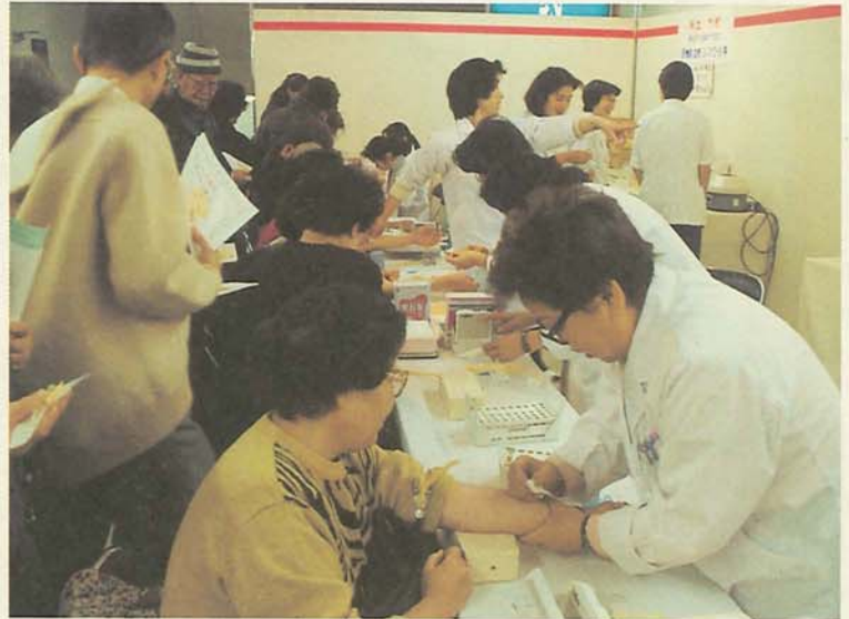
あなたの家族の健康について、あらためて見直してみたいかですか