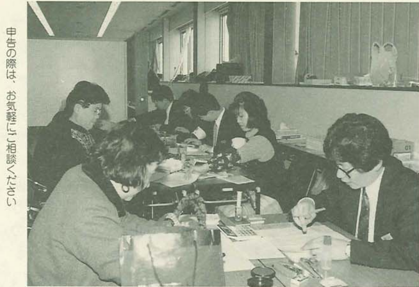
申告の際は、お気軽に相談ください。