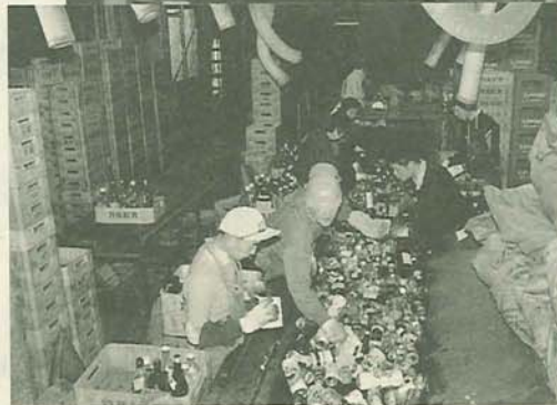
リサイクルセンターでは、ビン・カンなどの有価物を回収し、再利用しています

市民が一体となって取り組む環境基本計画。将来にわたって良好な環境を確保することは、私たちの大切な役割です。昨年末、地球温暖化防止に関する国際会議が京都で開かれ、世界的にも地球環境の問題は深刻になっていきます。 環境基本計画は、次の世代により良い環境を受け継ぐための取り組みをまとめたもので、①自然のサイクルを大切にす循環型社会の構築②自然との共生とやすらぎの確保③みんなが参加する環境学習・保