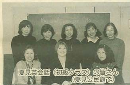
夏見英会話(初級クラス)の皆さん(夏見公民館)

▽公民館から歩いて軽スポーツを楽しむ 2月15日(日)午前9時夏見・高根・新高根