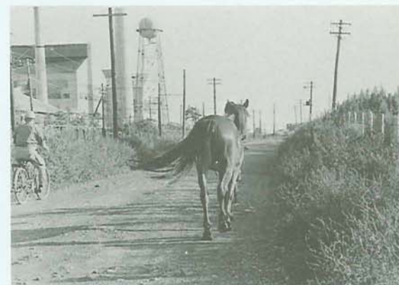
▲ロープワークの練習で、第一回面会のお披露目。少年団のメンバーが、