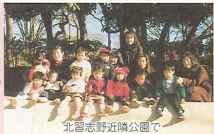
北志野近隣公園で

健康管理課 ☎2415 保健指導課 ☎2382 (〒273 湊町2-10-25)