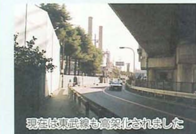
現在は東武東上線高架化されました