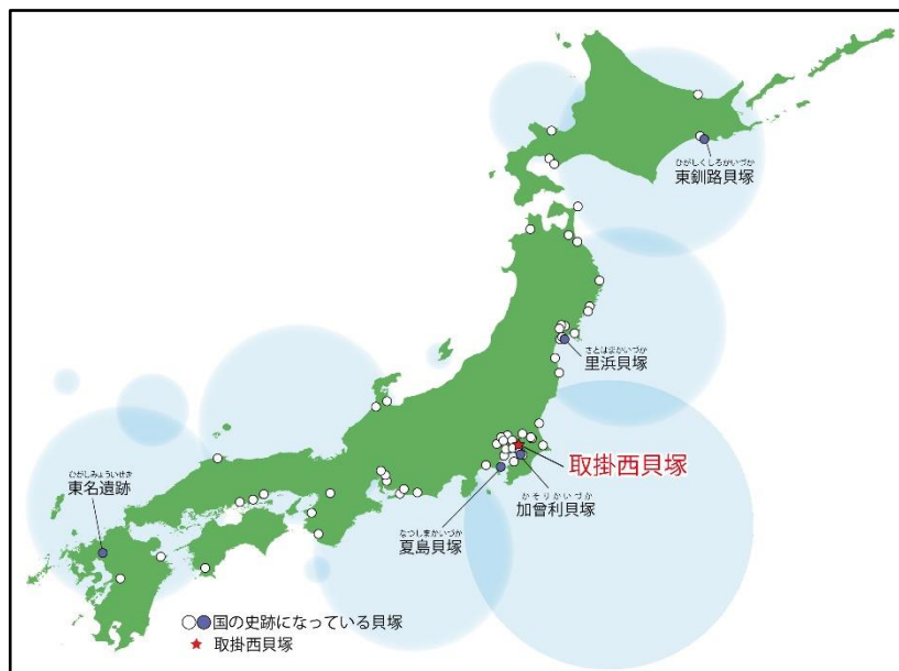
国史跡に指定された貝塚

将来の史跡整備計画の策定に際し、商業・観光と連携した史跡活用の視点も取り入れるよう検討する。