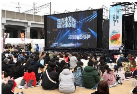
パブリックビューイング