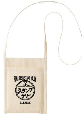
限定プレゼント（サコッシュ）