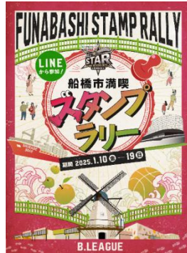
デジタルスタンプラリー