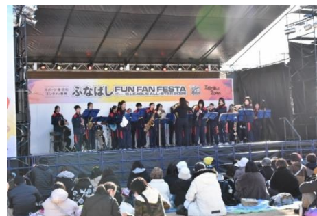
ステージパフォーマンス