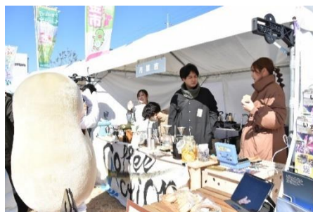
県内自治体の PR ブース出展