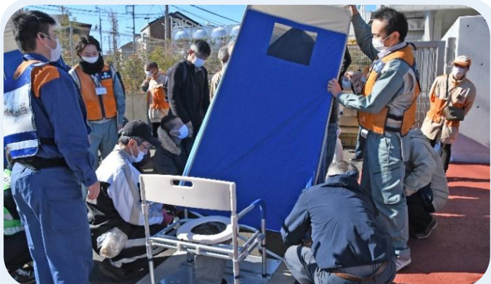
安全・安心なまちづくり