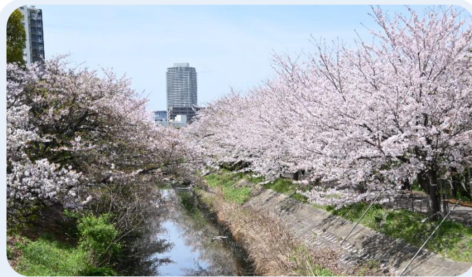
人と環境にやさしいまちづくり